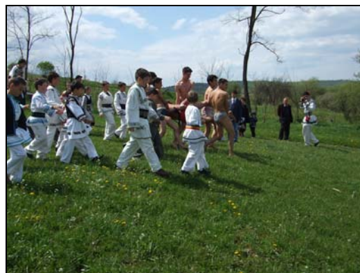
Sărbătoarea plugarului – Fărăgău 2006 Pogăniciul – Sînmihaiu de Pădure – 2008

La Sînmihaiu de Pădure, în prima zi de Paști, odată cu cel care a ieșit primul la arat, este sărbătorit și cel care mîna vitele cînd se ară – „pogăniciul”. El trebuie să fie un fecior neprihănit și harnic, iar alegerea lui ca „pogănici” reprezintă recunoașterea acestuia ca membru al colectivității sătești, sărbătorirea lui constituind un rit de inițiere în muncile agricole. Urmărit de cei șapte „fugari”, pogăniciul fuge pe „răzoare”, apărîndu-se cu o curea și încercînd să nu fie prins. Trebuie să treacă rîul, să ajungă la biserică și să tragă clopotele, semn că întrecerea a luat sfîrșit. Astăzi, chiar dacă obiceiul se mai practică, el s-a schematizat și deritualizat, fiind mai degrabă un spectacol, principala atracție constituind-o acum masa și jocul de la casa sărbătoritului.