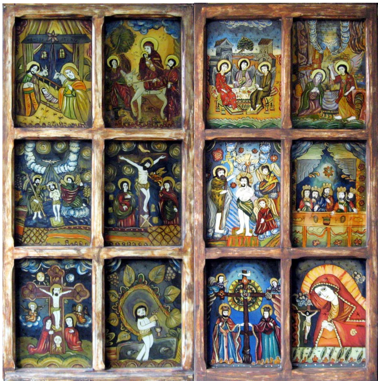
„ICOANA DIN FEREASTRĂ” – ICOANA ÎNTRE TRADIȚIE ȘI MODERNITATE

* Serie veche nouă* Anul I, nr. 2, aprilie 2009