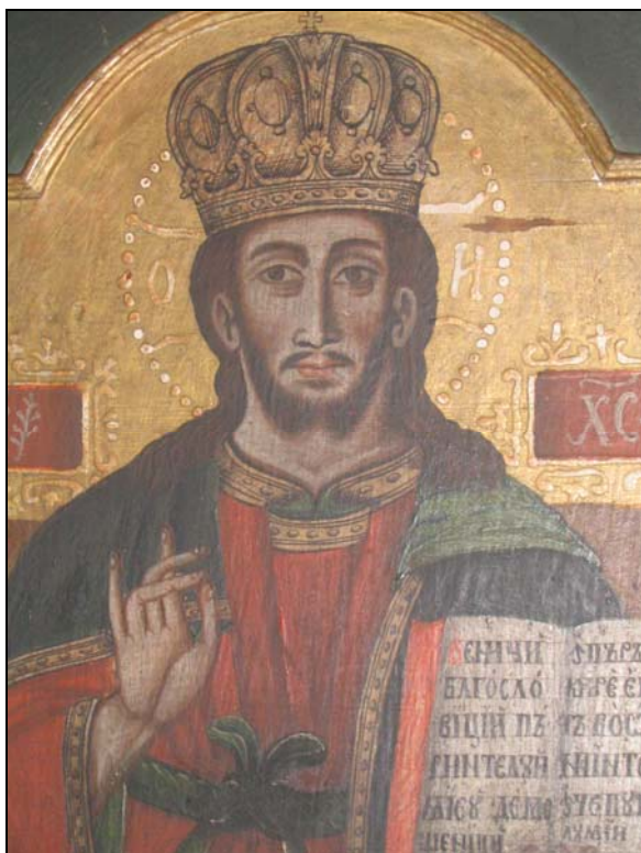
Iisus Hristos învățător, icoană împărătească pe iconostas – dreapta