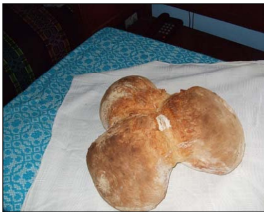
Pâinea Paștilor la Sînmihaiu de Pădure (aprilie 2008)

Aceste zile premergătoare sînt rezervate și unor rituri de purificare, de sîmbătă pînă luni, bătrînele satului nu mănîncă nimic. Este așa-numitul „post negru” care durează pînă după sfințirea Paștilor. În noaptea de sîmbătă spre duminică, în biserici se face slujba Învierii. Se