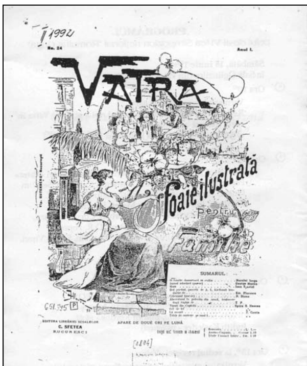
VATRA, FOAIE ILUSTRATĂ PENTRU FAMILIE (1894)