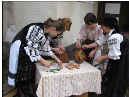
Pâinea Paștilor și vopsitul tradițional al ouălor cu foi de ceapă la Deda (aprilie 2006)