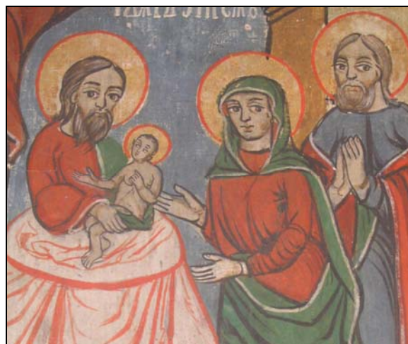
Icoană de pe iconostas

Pe iconostas, deasupra icoanelor împărătești, dar la dimensiuni mici, se află, la primul nivel icoane reprezentând diverse scene biblice: „Nașterea Preceștii”, „Prezentarea Mariei la templu”, „Nașterea lui Iisus”, „Botezul lui Iisus”, „Tăierea împrejur”, „Bunavestire”, „Duminica Florilor”, „Învierea lui Isus”, „Înălțarea lui Iisus”, „Pogorârea Duhului Sfânt”, „Sfânta Treime”, „Schimbarea la față”, „Adormirea Maicii Domnului”.