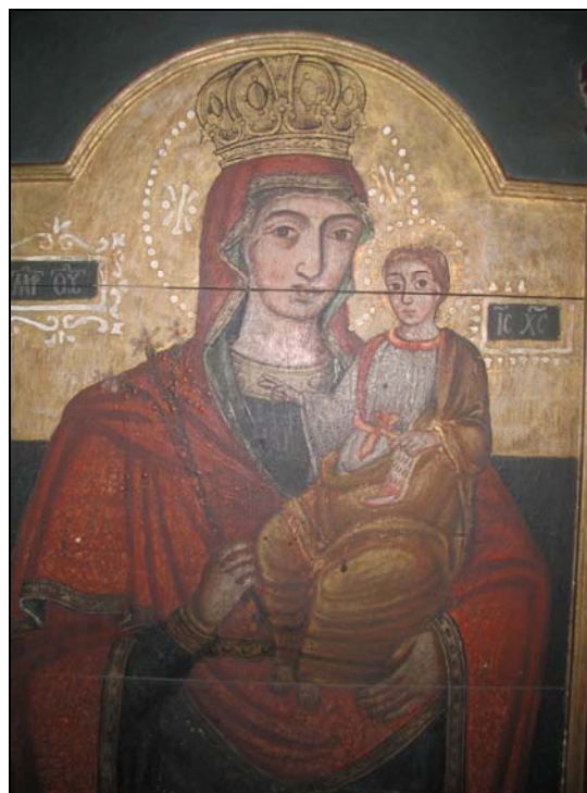
Maica Domnului cu Pruncul în brațe (Icoană împărătească pe iconostas – stânga)