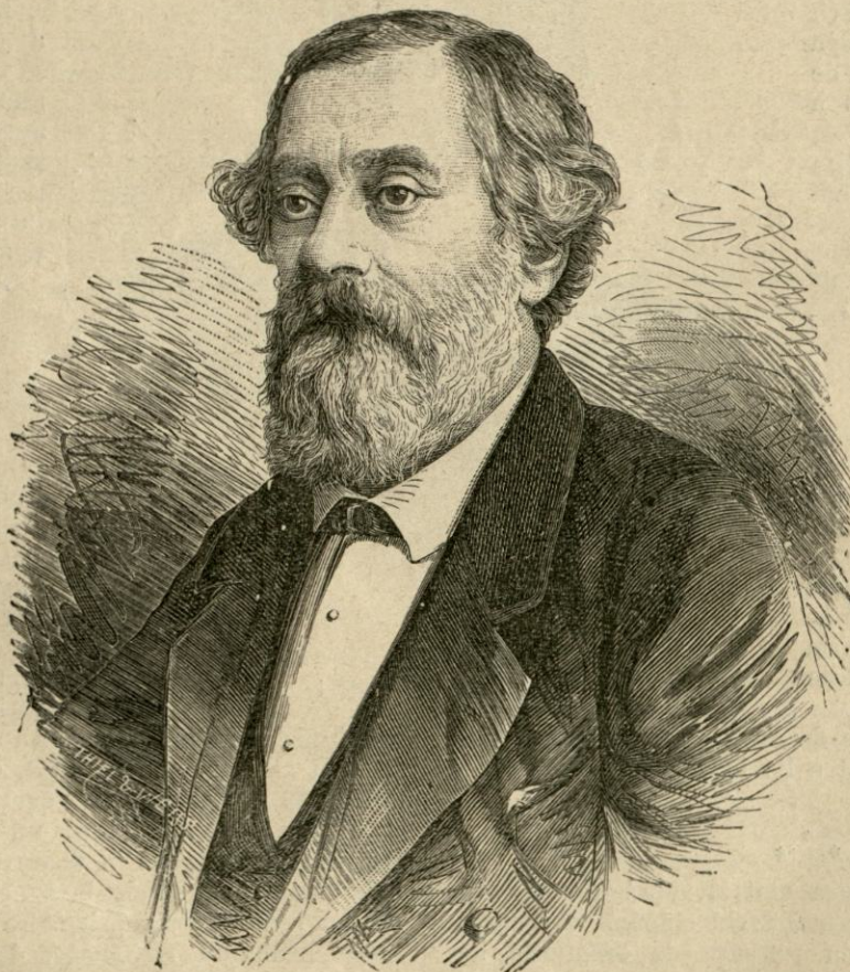
C. A. ROSETTI

Al doilea, Ioan C. Brătianu, a fost cel mai adevărat reprezentant al ideii naționale române în viața europeană, unul dintre oamenii, care cresc cu trecerea timpului. E prea de curēnd murit, pentru-ca să se poată vorbi despre dēnsul; prea suntem încă sub înariurirea vicții lui, pentru ca să putem avea o judecată dreaptă asupra faptelor lui. S'a ȳis încă pe când era în viață, că el a fost un om providențial. Providențialii au fost ei toți, și cei care minău înainte și cei care își încordaū puterile, pentru ca în mersul ei prea repede țara să nu se dea de-a valma. E peste putință să ne gândim la Ioan C. Brătianu, fără ca să