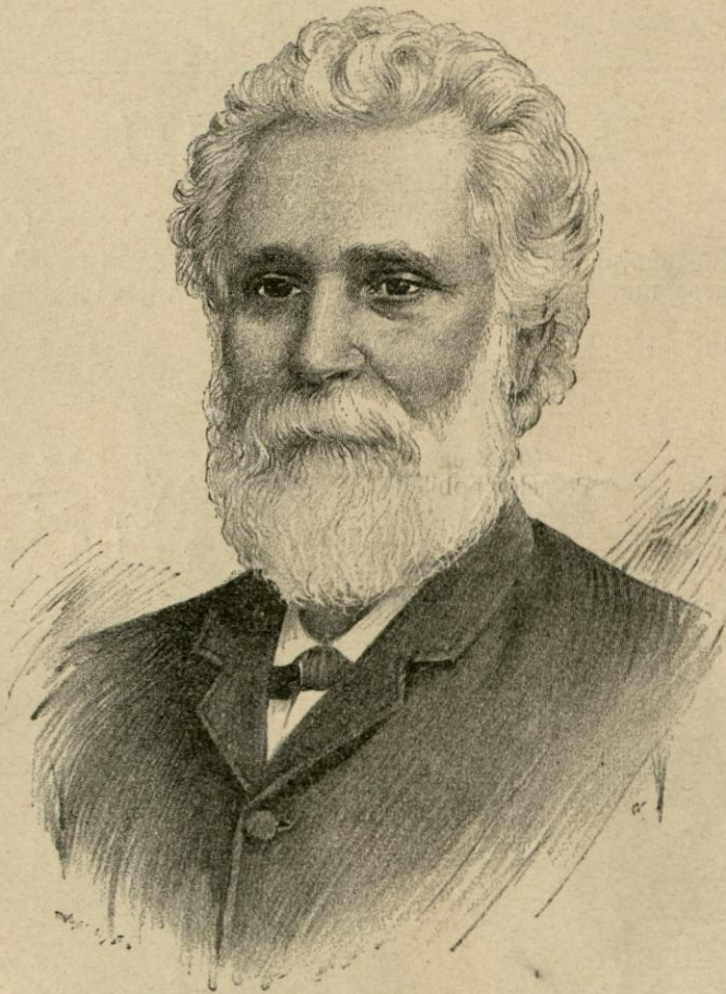
I. C. BRĂTIANU

Gândul acesta n'a putut să intre în mintea lui Avram Iancu, Moțul adevărat, care nu știe ce va să dică a minți și nu poate să înțeleagă, cum e cu puțință, ca omul să promită ceea ce nu este hotărit să și impli-