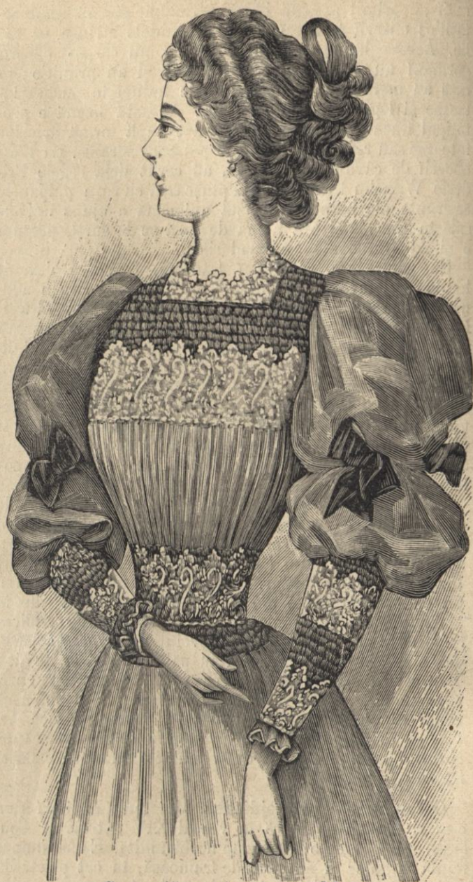
Corsagiū pentru preumblare