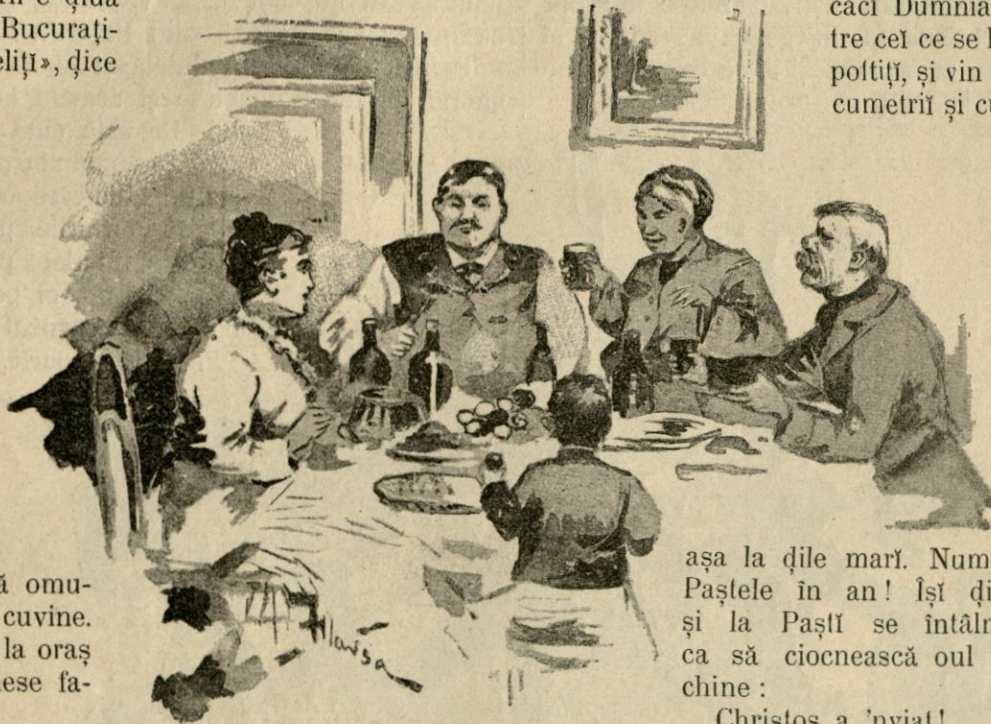
CHRISTOS A INVIAT ȘI LA MULȚI ANI