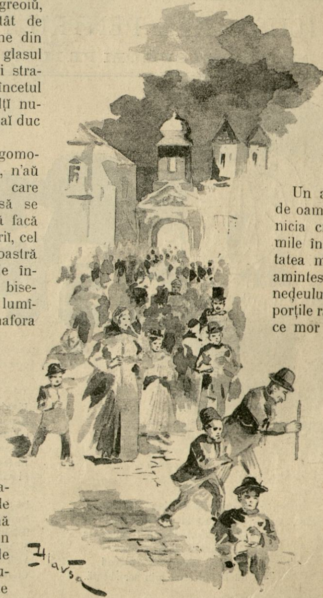
DE LA ÎNVIERE.