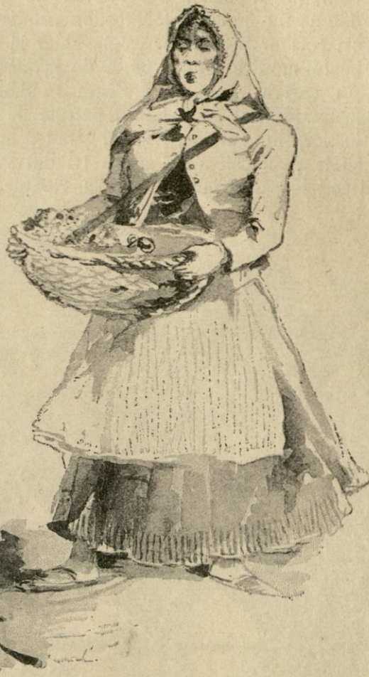
[ CALDE FLORICELE !

Toată săptămâna Românii Macedonenii o petrec adunându-se bărbații la vr'un prietin, iar femeile la vr'o prietină, și cântă