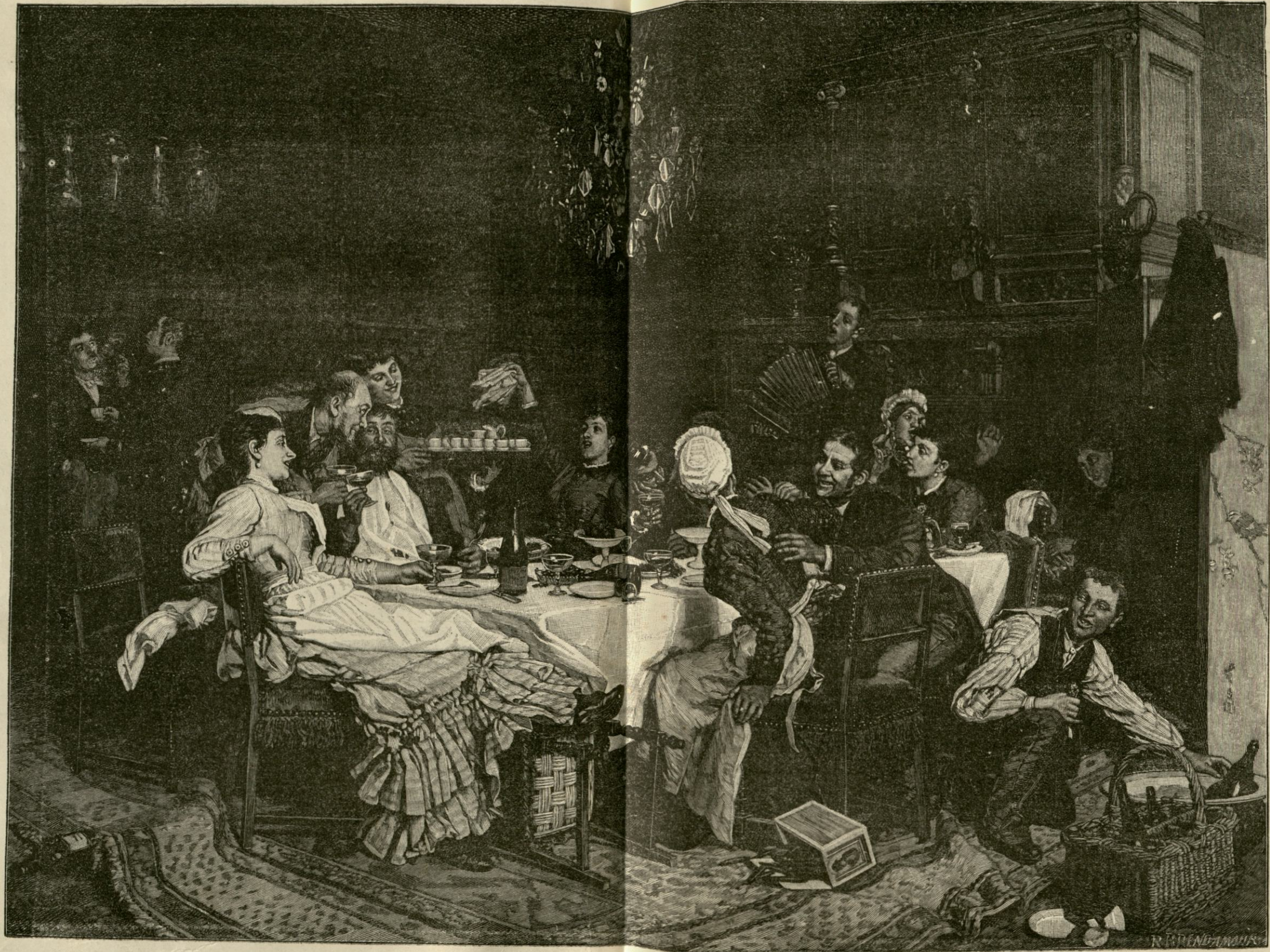
Când pisica nu-i acasă