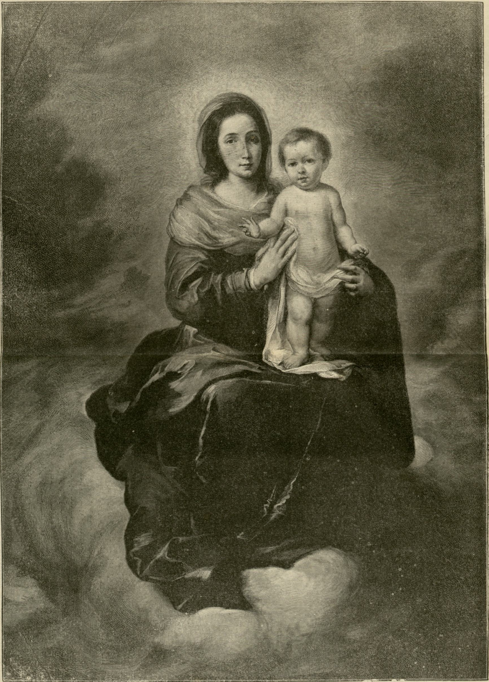
Maria cu Isus Christos