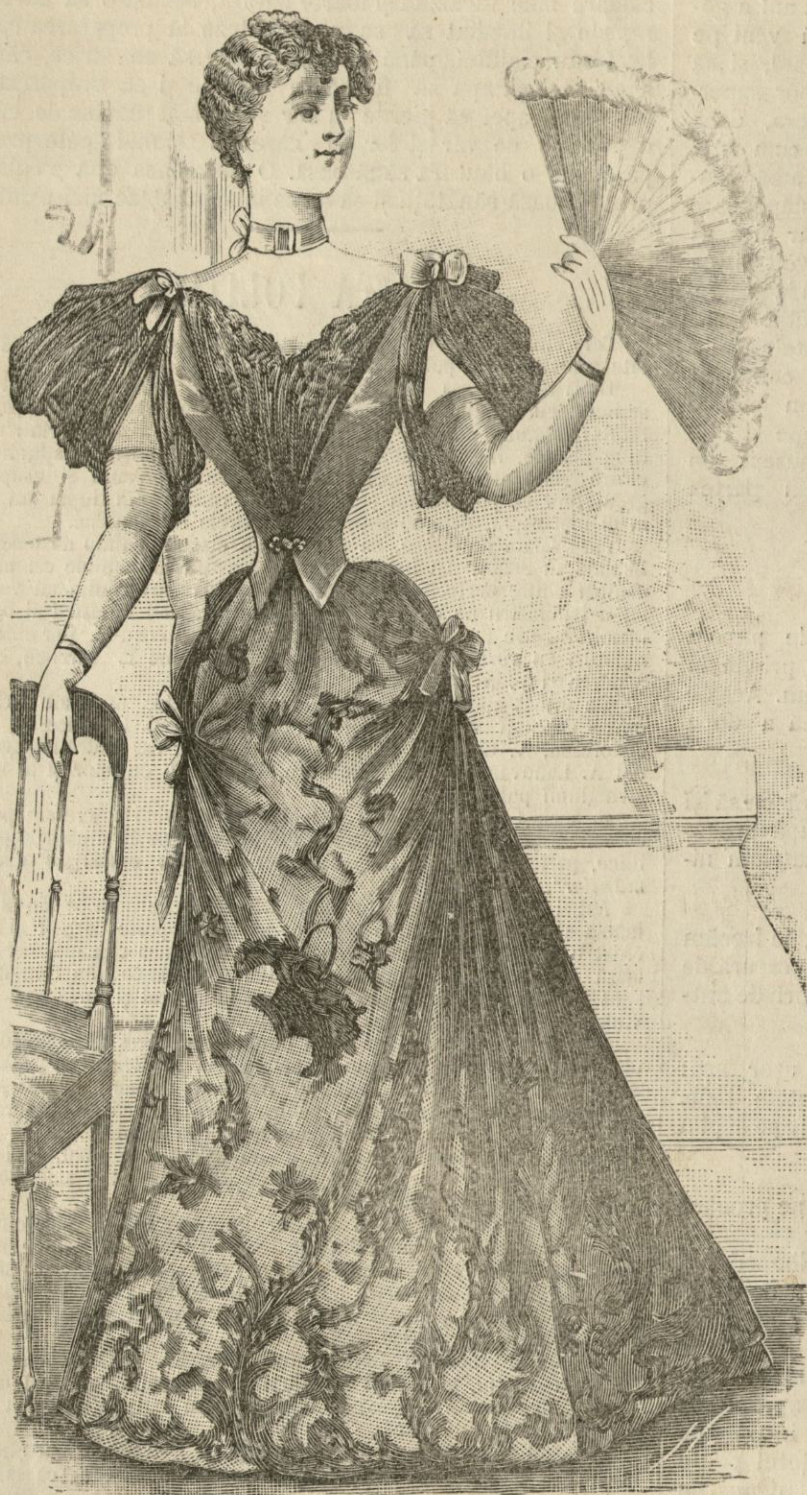
Tualeta de serate sau de pranzuri de gala