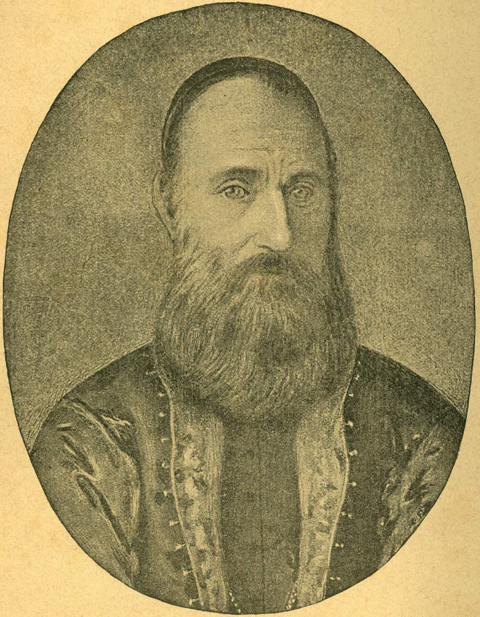
Episcopul Vasiliu Moga.