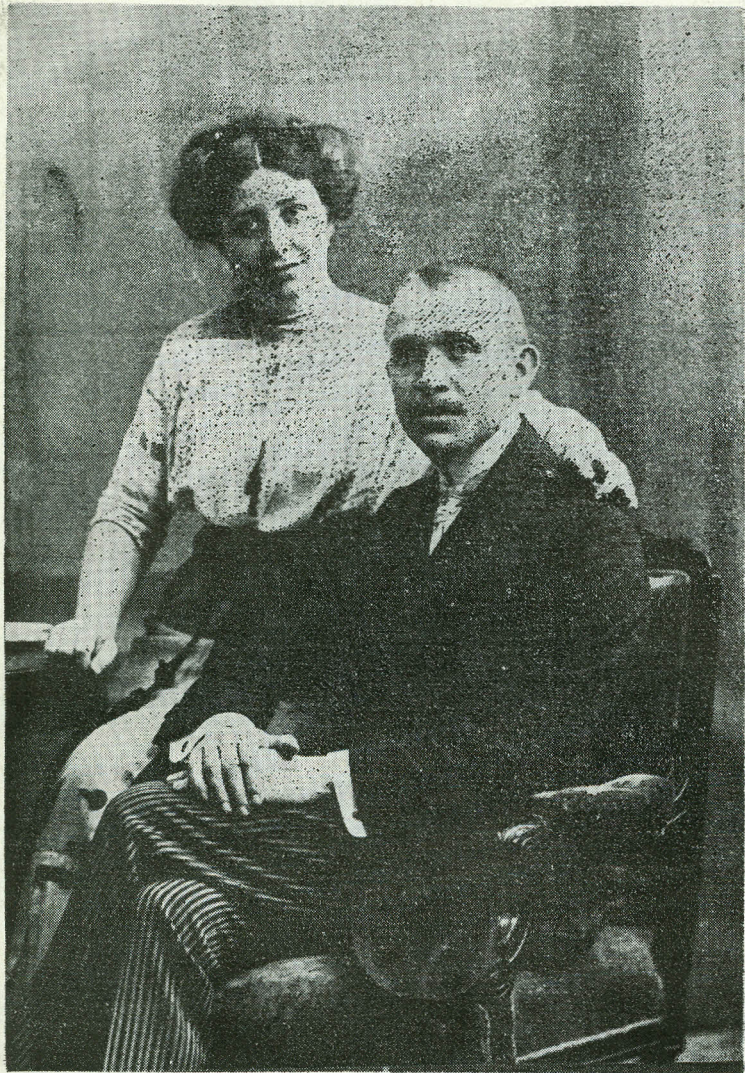
Onisifor Ghibu cu soția, la Sibiu, după ce s-au căsătorit (1911)