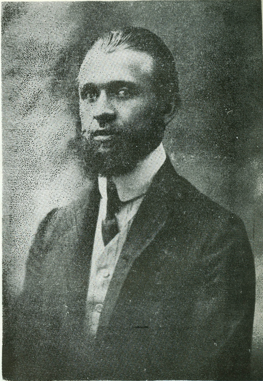
Student la Universitatea din Strasbourg (1908)