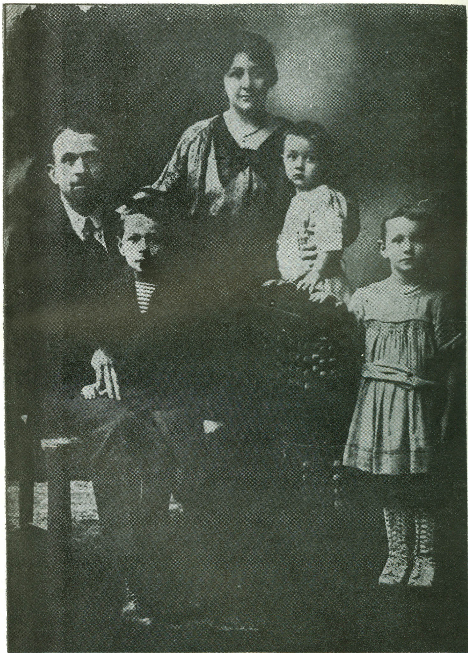
La Cluj, cu soția și primii trei copii, după înapoierea din refugiu (1919)