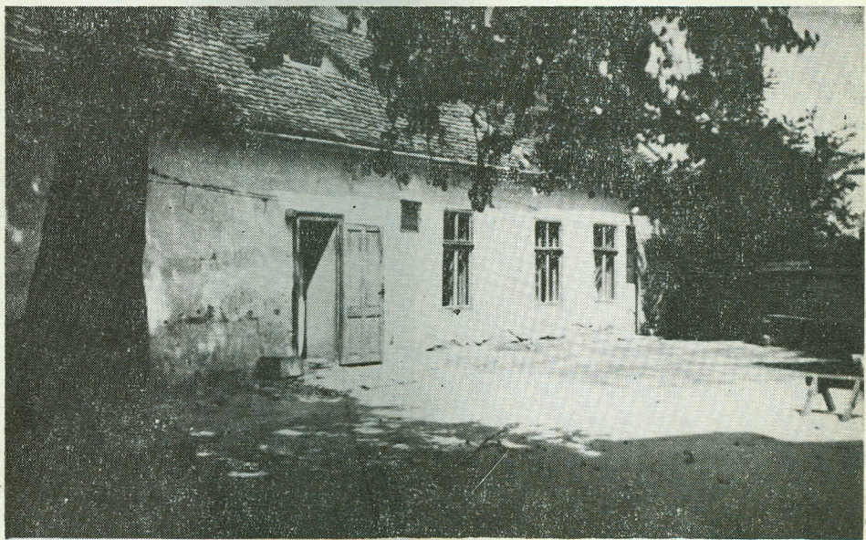
Casa în care a locuit „în gazdă” la Sibiu, ca elev în clasa a VI-a (1899—1900)