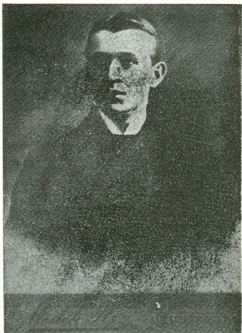
Student la Budapesta și redactor la „Lupta“ (1907)