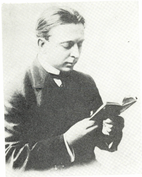
Octavian Goga la 30 de ani