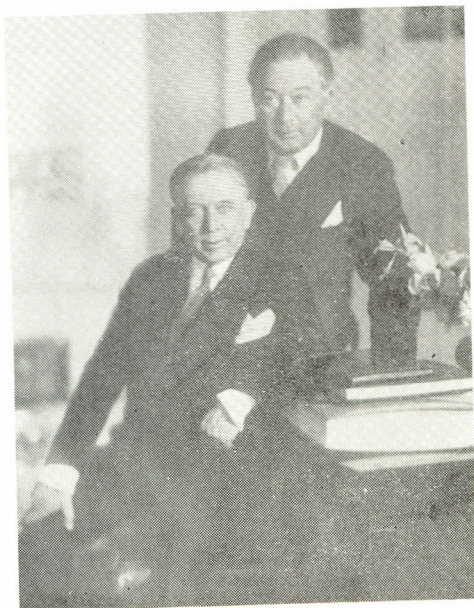
Octavian Goga cu fratele său, romancierul Eugen Goga