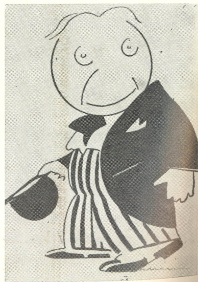
O. Goga în caricatură vremii