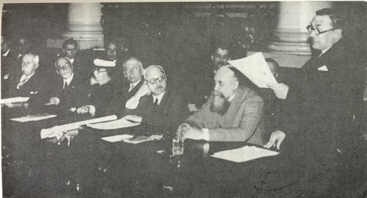
O. Goga C. Euzenou Societate y Jij