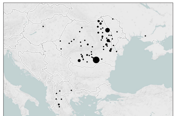
Fig. 2. Orașele de proveniență a scriitorilor români