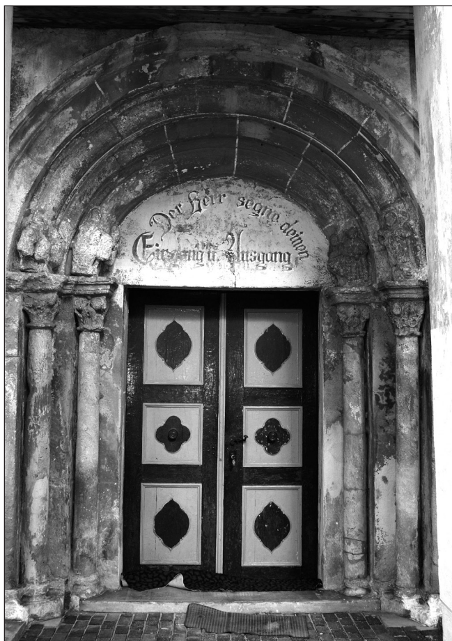
Portal vestic, biserica evanghelică din Avrig, România