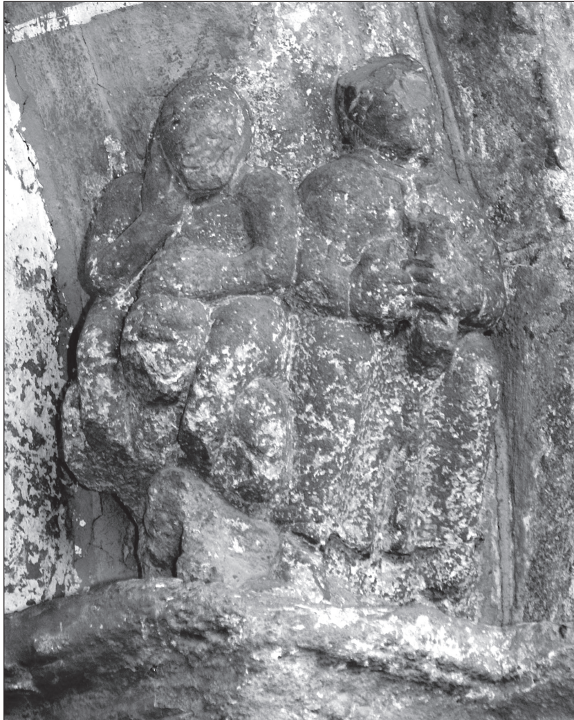
Lupta Credinței cu idolatria, portal vest, biserica evanghelică din Avrig, România