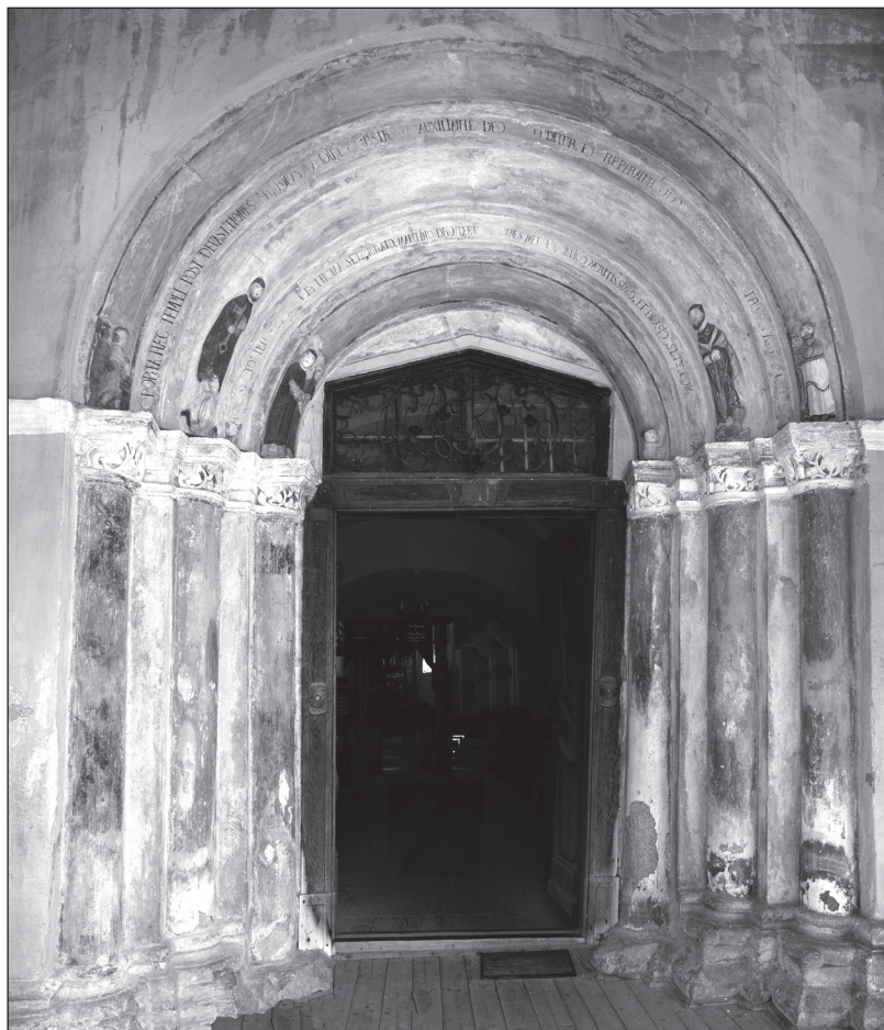
Portal de vest, biserica evanghelică din Hosman, România