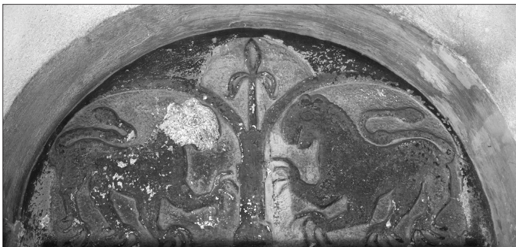
Arborele vieții, portal vest, biserica evanghelică din Ocna Sibiului, România