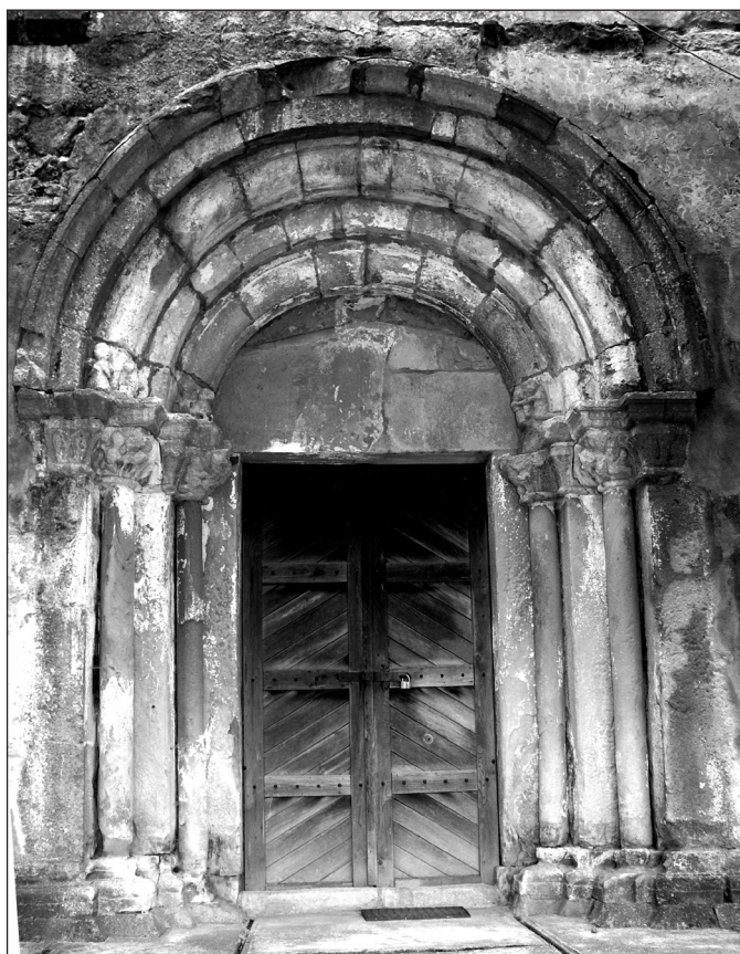
Portal vestic, biserica luterană din Săcădate, România