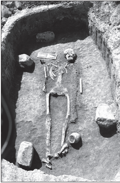
Fig. 6. M. 168 with Säbelschwert and ceramic pot.