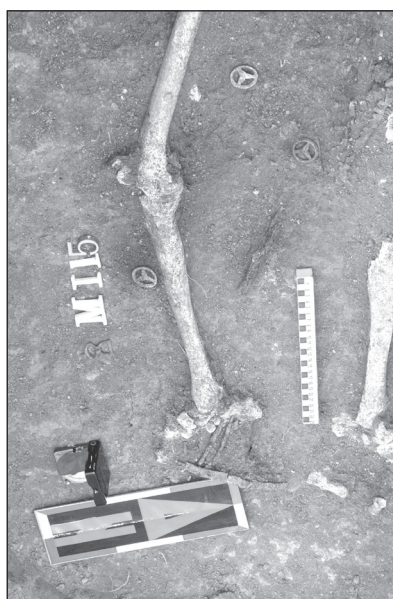
Fig. 1-2. M. 115 with funerary inventory (bow plaques, remains of quivers, belt disposers).