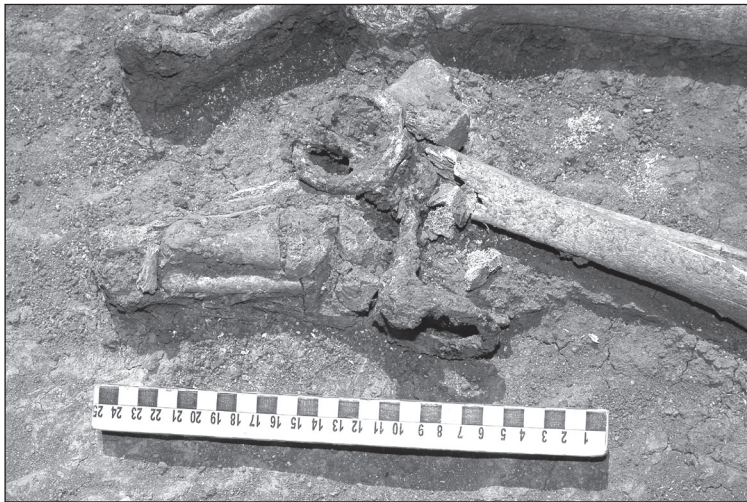
Fig. 7. M. 173 with funerary inventory (stirrups and bridle).