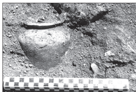
Fig. 3-5. M. 165 with equine offering, ceramic pot and battle-axe.