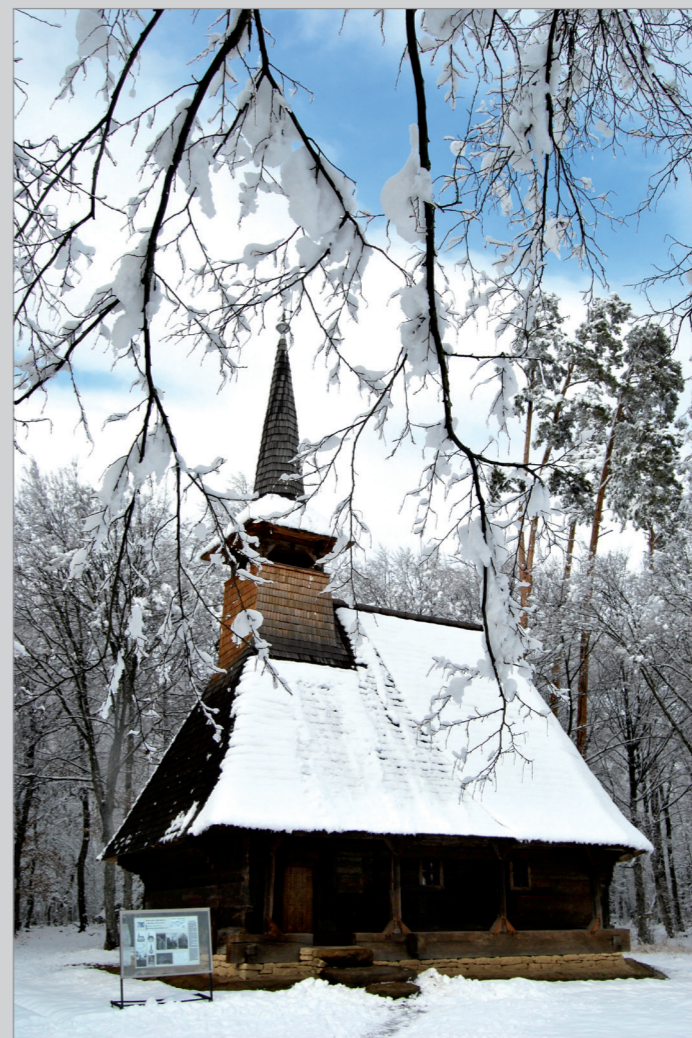
Copertele 1 - 4: Fotografii din Arhiva de imagini a Muzeului ASTRA.