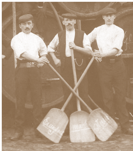
Fig. 138. Caransebeș. Lopeți de „mălțărit”, produse la fabrica „Frații Adler”, în jurul anului 1910

O ramură a industriei lemnului, unde procesul de mecanizare s-a petrecut foarte lent și cu investiții restrânse pentru achiziționarea unor mijloace tehnice mai moderne, a fost cea destinată producției vehiculelor puse în mișcare cu tracțiune animală: căruțe, trăsurii și sănii . În anul 1944 mai existau ateliere-fabrici care încă nu foloseau mașini de forță (ex. firma Wendel Carol și fiii, din Sibiu).