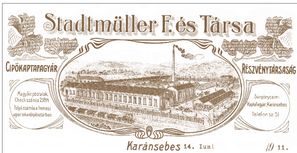
Fig. 137. Caransebeș. Fabrica de calapoade „Stadtmüller F. és Társa”, în jurul anului 1910

Cea mai mare fabrică de schiori din România anilor 1940 se numea „Industriile Unite Serdaru” din Șendreni (jud. Iași), având o producție de 5.000 de perechi de schiori pe an.