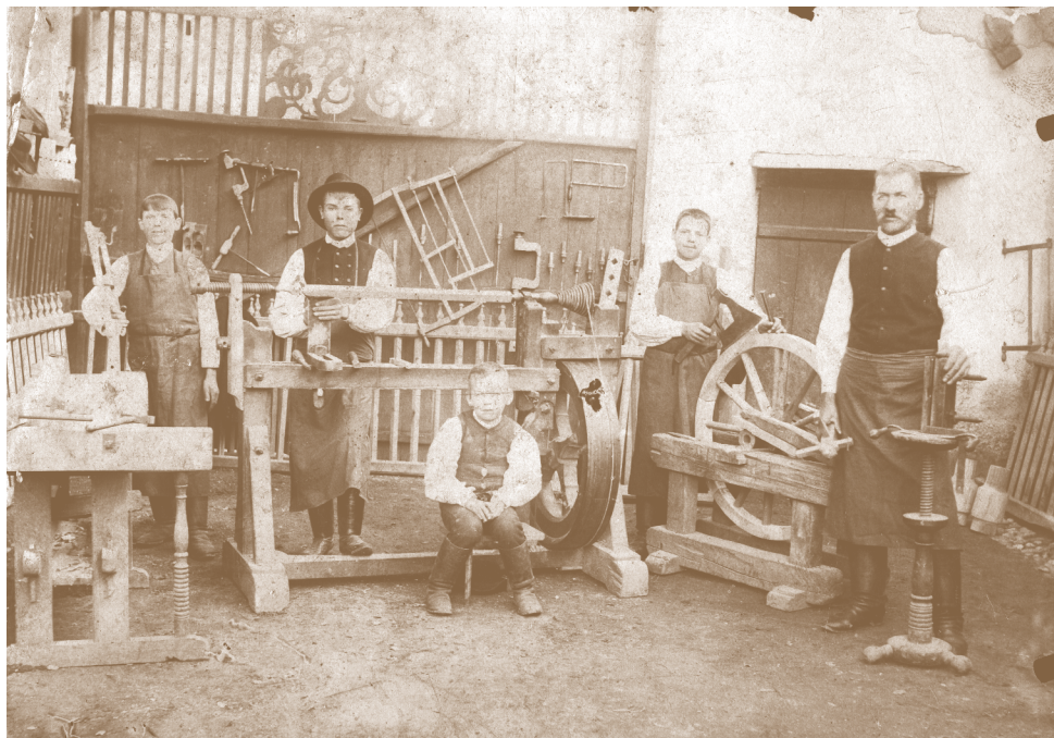
Fig. 141. Secuime. Atelier de strunjit în lemn , în jurul anului 1905

până la 500 de căruțe (de diferite tipuri), volum depășit numai de „Industria lemnului din Codlea” (menționată deja), cu 750 de bucăți de diferite tipuri de căruțe.