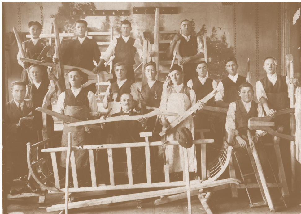
Fig. 140. Moșna (jud. Sibiu). Atelier de fabricat care și căruțe, în jurul anului 1915;