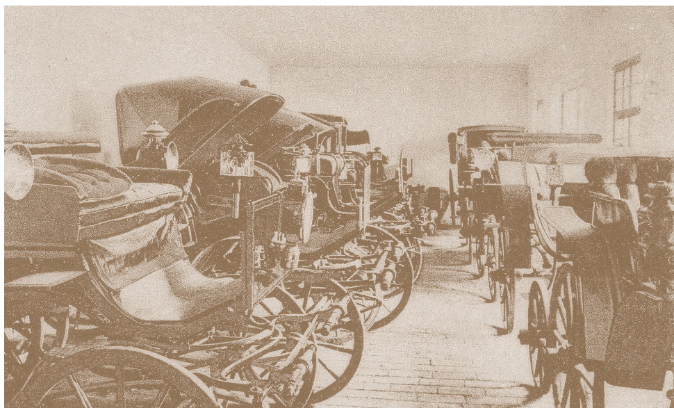
Fig. 139. a) Atelierul de trăsurii Ludwig din Timișoara în anul 1904

La fabrici mai importante, în care se lucra cu mașini mai moderne, cum a fost „Traian Soc. pentru industrie de lemne” din București, se atingea o producție de