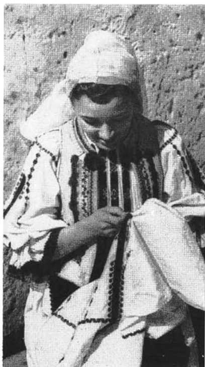
Tinără cu pahiol brodind