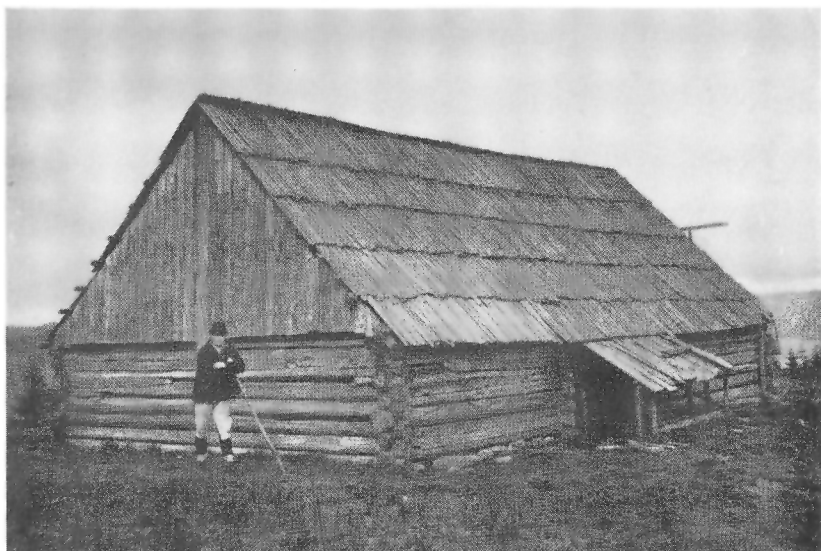
Stână de la poalele Cindrelului

și Moldovei prin diferite privilegii. «Păstorii, ca străini, se bucurau de-alungul veacurilor de privilegii mai mari decât pămîntenii». 1) Datorită acestui fenomen de transhumanță, la care se adaugă și numeroasele refugieri ale populației marginene, din cauza nedreptăților și asupririlor din trecut, au luat ființă în zona de contact din sudul Carpaților, în fostele județe Gorj, Vâlcea, Muscel și chiar în Dobrogea, numeroase așezări omenești, cunoscute sub numele de «sate ungurenești». Populația acestor sate nu numai că și-a conservat, în cea mai mare parte, formele de viață specifice, dar a influențat simțitor și populația băștinașă mai ales în domeniul portului.