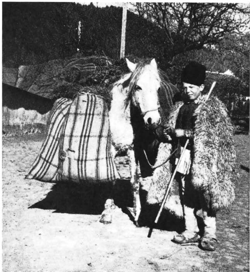
Transportul fînului cu desagi

și oile iernau la colibe, iar folosirea lor era devălmașă nu numai în cadrul unui sat ci chiar între mai multe sate învecinate. În felul acesta viața oamenilor în zona colibelor continua — cu o intensitate diferită, este drept — aproape tot timpul anului, cu tot caracterul lor de așezări temporare. Numai de la 1 mai și pînă la începutul lui iulie, perioadă în care «la finețe este hotar închis, ca să crească iarba», colibele erau aproape complet părăsite.