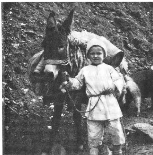
Transportul vaselor de la munte în sat