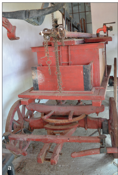
Fig. 502 a – c. Foeni (jud. Satu Mare). Atelaje de pompieri în colecția „Muzeului Morii” ; a) Pompă manuală montată pe trăsură hipo ;

fațadei și este fragmentat în panouri prin profile de tencuială. Fosta cazarmă a pompierilor este trecută în LMI, jud. Satu Mare, la nr. 145, având codul de clasificare SM-II-m-B-05234 (Fig. 501 a – b).