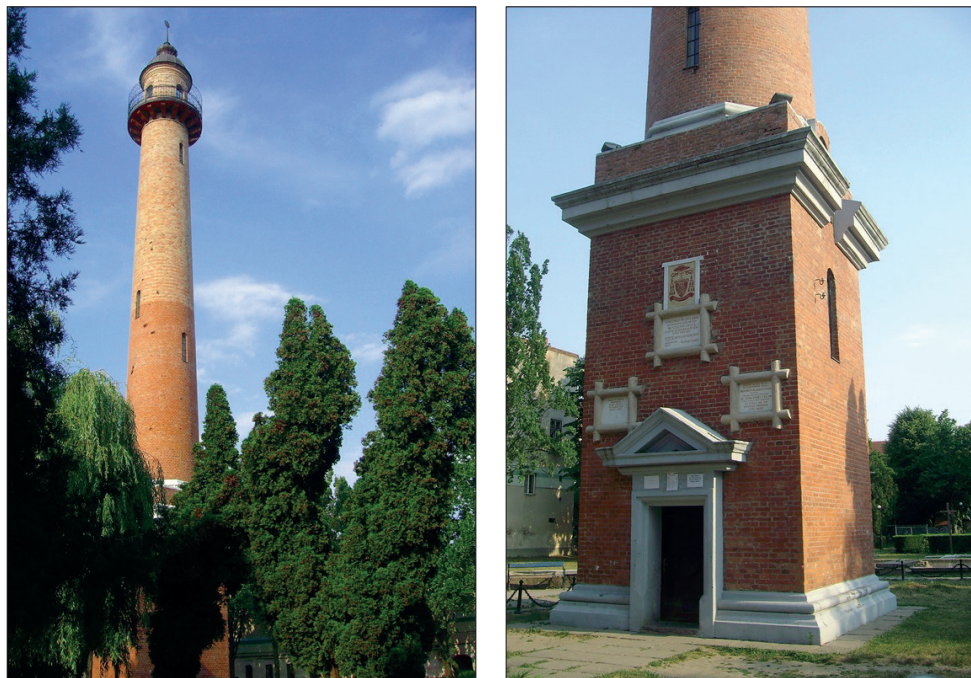
Fig. 499 a - b. Satu Mare (jud. Satu Mare). Turnul Pompierilor cu înălțimea de 47 m, construit între anii 1903-1904 (Foto: 2013)

este de asemenea variabilă, reducându-se în trepte de la 80 cm la bază până la 45 cm sub nivelul balconului circular. Accesul până la platforma balconului circular se face printr-o scară metalică în spirală cu 147 de trepte. La înălțimea de 33,75 m se află platforma balconului circular perimetral, realizată sub formă de planșeu de lemn susținut de traverse metalice, cu o balustradă de protecție din fier forjat. Turnul este tencuit în interior, iar exteriorul are cărămidă aparentă. Turnul se termină printr-un coif executat din șarpantă de lemn și învelit cu plăci de alamă, imitând forma unui clopot (Fig. 499 a – b).