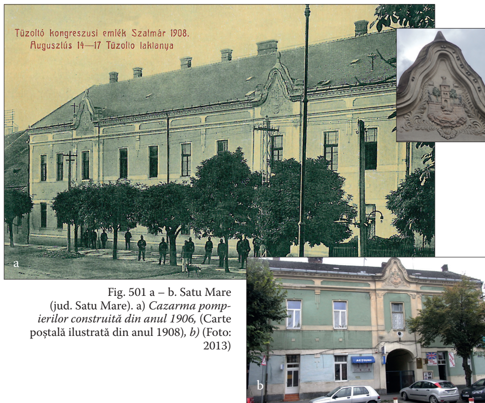
Fig. 501 a – b. Satu Mare (jud. Satu Mare). a) Cazarma pompierilor construită din anul 1906 , (Carte poștală ilustrată din anul 1908), b) (Foto: 2013)