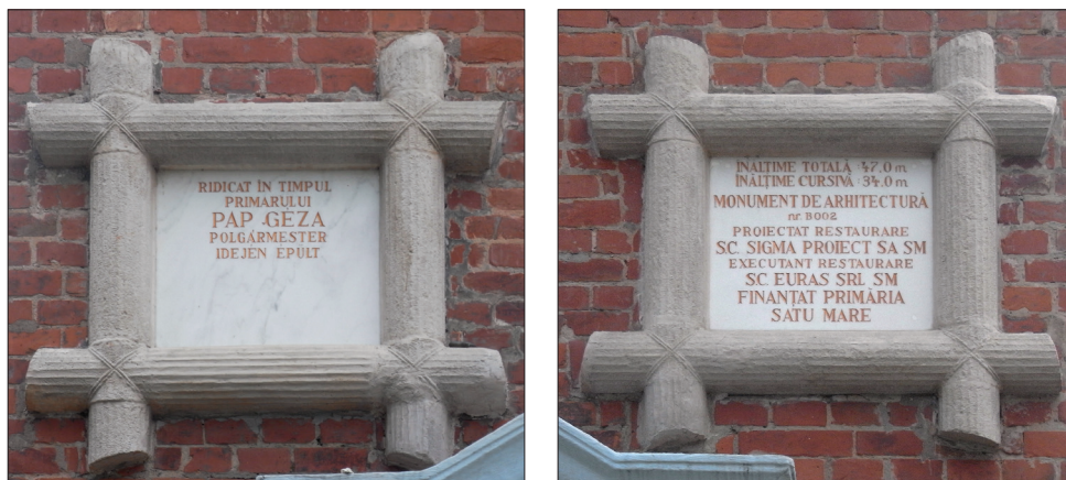
Fig. 500 a – c. Satu Mare (jud. Satu Mare). Turnul pompierilor: plăcile de marmură pe care sunt consemnate numele persoanelor și instituțiilor care au finanțat, proiectat, executat și restaurat această construcție monumentală, precum și cele mai importante date tehnice (Foto: 2013)