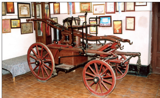
Fig. 490 a – b. Steierdorf (jud. Caraș Severin). Pompa manuală montată pe trăsură hipă tip „Kernreuter” (Foto: 2013)