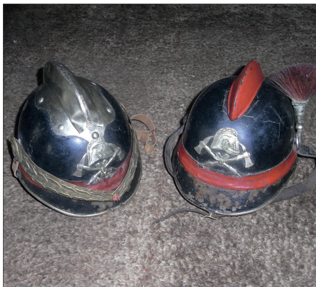
Fig. 487. Dognecea (jud. Caraș-Severin). Ustensile și accesorii din dotarea membrilor primei Asociații a Pompierilor Voluntari păstrată în remiză (Foto: 2013)