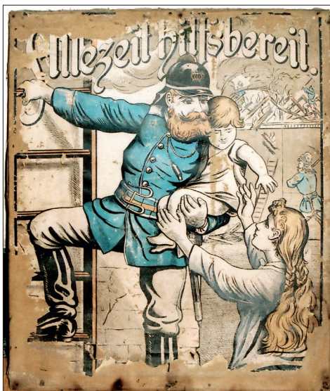
Fig. 491 a – b. Reclame imprimare pe pânză, achiziționate de Asociația Pompierilor Voluntari din Steierdorf la Viena împreună cu cele două pompe tip „Kernreuter” (Foto: 2013)