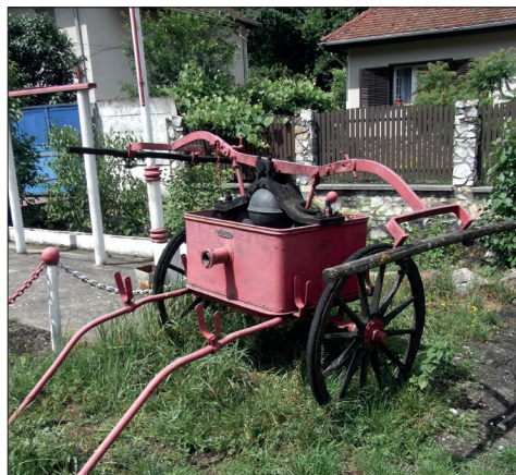
Fig. 488. Ocna de Fier (jud. Caraș-Severin). Pompă manuală tip „Tarnóczy“ (model 1893) expusă pe strada principală (Foto: 2013)