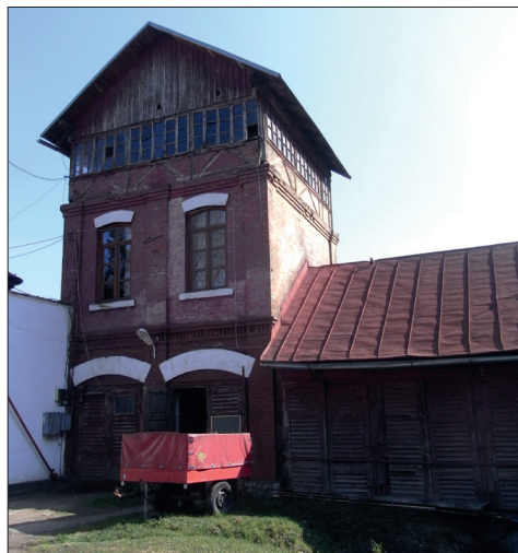
Fig. 489. Steierdorf (jud. Caraș-Severin). Remiza Asociației Voluntare de Pompieri din Steierdorf înființată în anul 1881 (Foto: 2013)

trul comunei Ocna de Fier . Ea poate fi trasă de un singur servanț (Fig. 488).