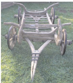
Car de fân, Feneș, județul Alba