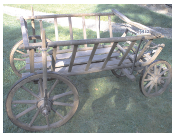
Car de boi, Costești, județul Vâlcea