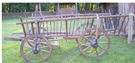
Car de ogașe, Drăguș, județul Brașov