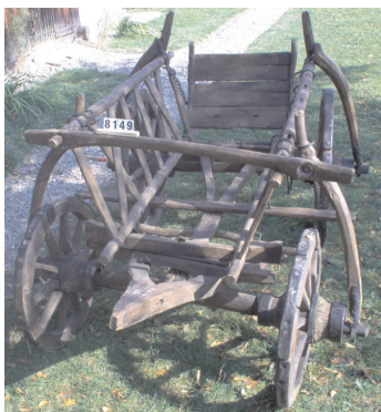
Telegă, Viștea de Jos, județul Brașov