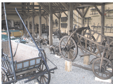
Imagine din Pavilion

Problema lor tehnică este realizarea deplasării unei poveri utile pe o anumită distanță, caracterizată prin variabile de dificultate, îndeosebi frecarea de mediul terestru sau acvatic, situație ce trebuie eliminată prin procedee tehnice specifice: tâlpi care să alunece pe zăpadă, gheață sau chiar pe sol, dar mai cu seamă roți. Raportul între viteza deplasării, distanța parcursă și cantitatea de povară transportată va fi ecuația esențială a oricărui transport tradițional sau popular, în funcție de nivelul de civilizație atins de comunitatea umană.