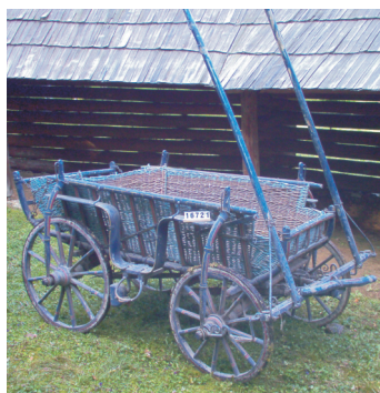
Căruță pictată, Ludoș, județul Sibiu