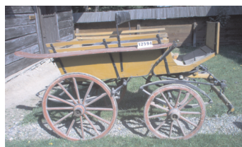
Birjă, Vicșani, județul Suceava