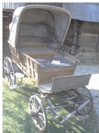
Căruță poștalion, Rășinari, județul Sibiu