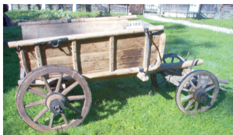
Căroaie, Mohu, județul Sibiu