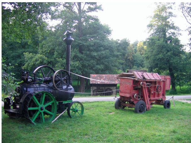
46 B | Batoză (Gura Râului, județul Sibiu) acționată de 46 D | motor cu aburi (Pâncota, județul Arad)

L ocomobilul (achiziționat în anul 1995 din localitatea Pâncota, județul Arad) a fost construit în anul 1889 la Atelierele Regale din Budapesta, fiind utilizat la acționarea batozelor de treierat grânele. Agregatul este înzestrat cu sistem de autopropulsie destinat deplasării pe "arie", în locul unde se executa operațiunea de treierat, dar datorită masei sale, a manevrabilității și forței motrice relativ reduse dezvoltate de motor, nu era utilizat pe scară largă precum un mijloc rapid și util de transport.