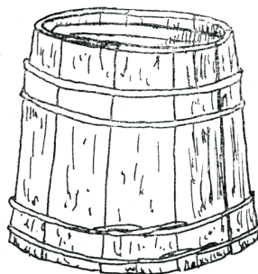
Găleată de muls