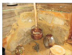
Chetrarul (vatra focului)

Transferată în muzeu, în anul 1980, din zona de fânațe a localității Rășinari (dealul Dârjani, 1206 m altitudine) județul Sibiu, această construcție pastorală, aparținând categoriei ocoalelor poligonale, constituie un ansamblu arhitectonic format din adăpostul oamenilor (coliba) și adăpostul pentru oi ( staorul ), termen popular derivat din latinescul stabulum ,-i, având ca funcție iernarea oilor în hotarul satului, cu nutrețul pregătit în zona fânațelor, din timpul verii.