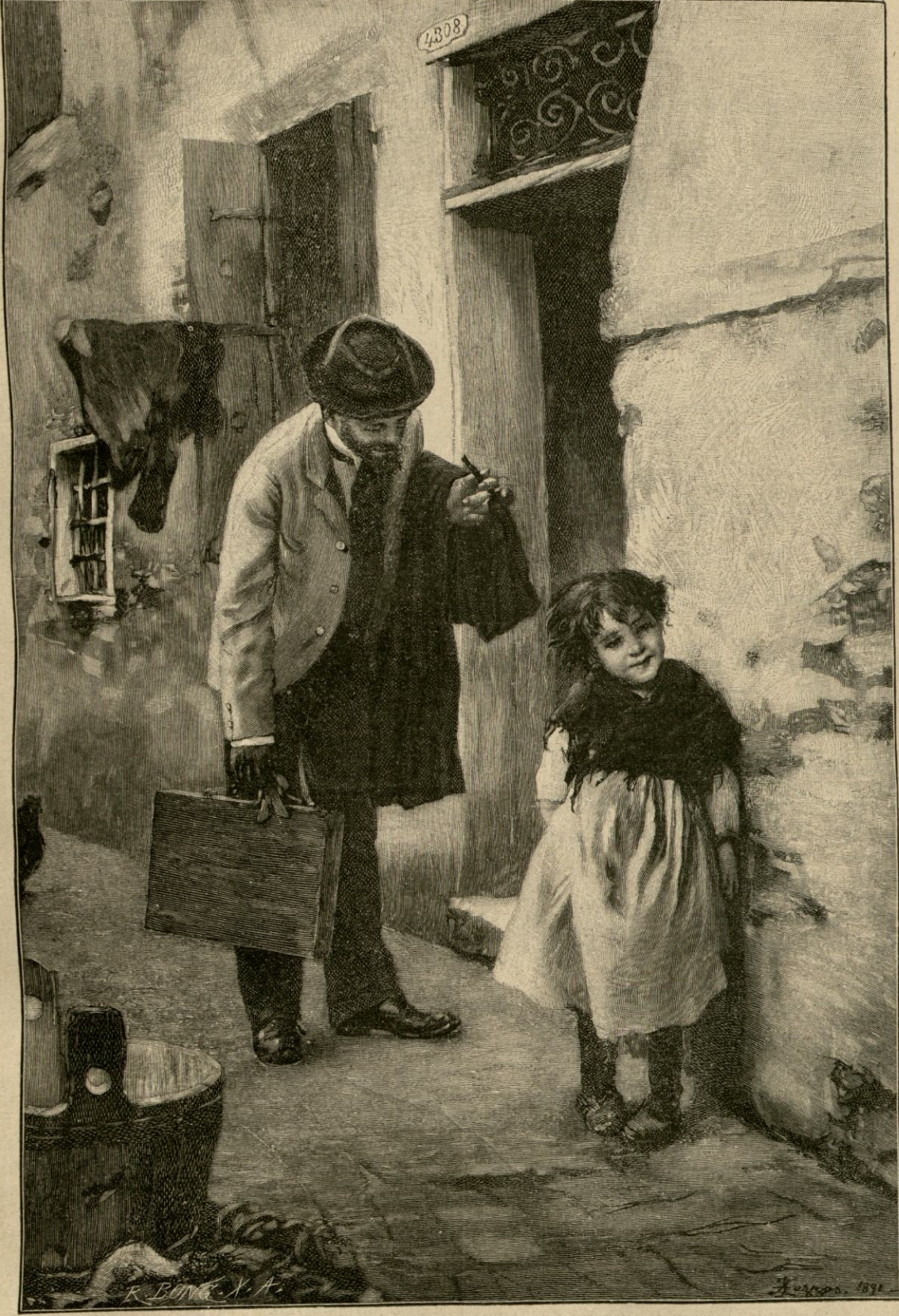
Urei sa te zugravesc? Tip. „Gutenberg“, București.