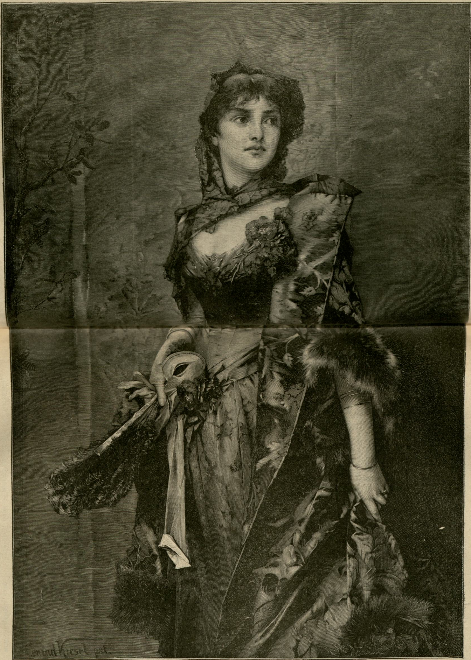
l a b a l