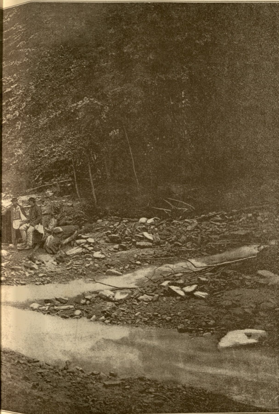
Din mntii nostri