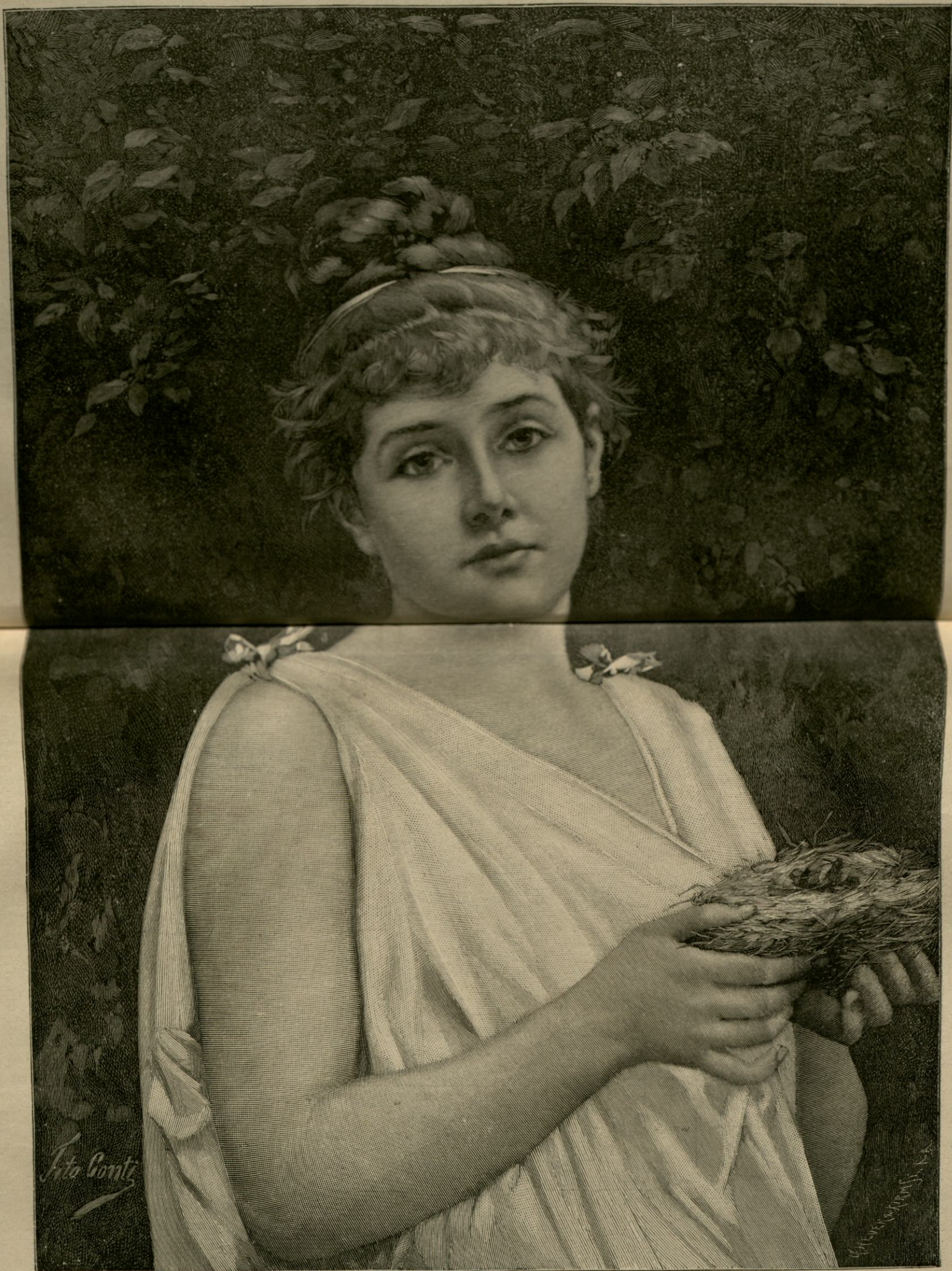
Saracutii de ei