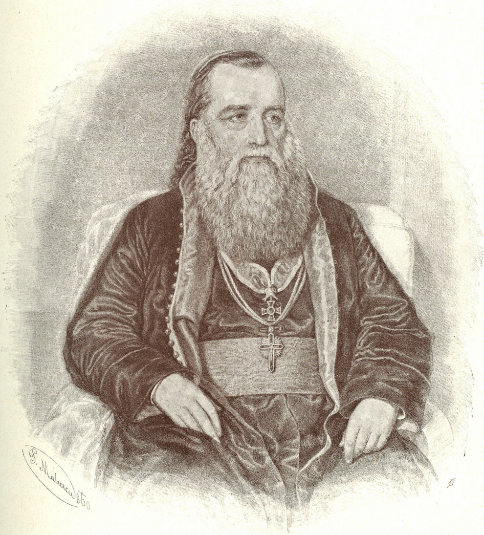
Arhiepiscopul și mitropolitul Andreiu Baron de Șaguna ca episcop 1846—1873.