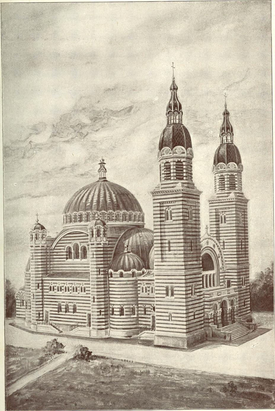
Catedrala română din Sibiu.