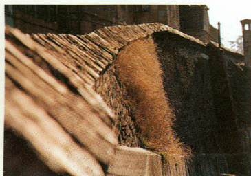
Les remparts de Sibiu.

“ Cela m'a fait plaisir de contempler les murailles de la forteresse. Combien de livres n'aurais-je pas lus sur les bancs de la promenade d'en - haut ! Le plus difficile de tous, ce fut La Critique du Jugement.