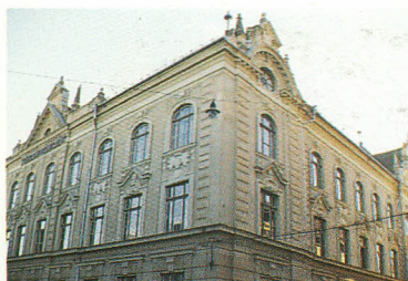
Sibiu. Le lycée Gheorge-Lazar.