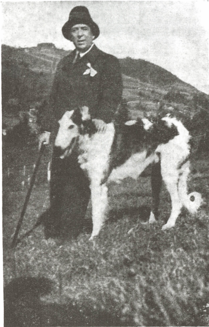
O. Goga la Ciucea în 1937.

La noi nevestele plângând Sporesc pe fus fuiorul, Și 'mbrățișându-și jalca plâng: Și tata și feciorul. Sub cerul nostru 'nduioșat E mai domoală hora, Căci cântecele noastre plâng — In ochii tuturor.