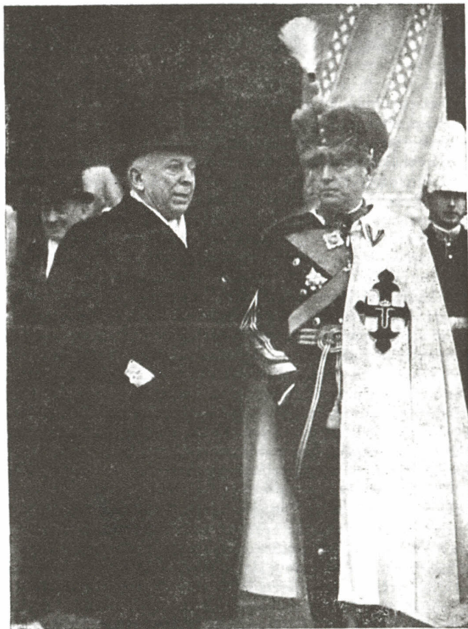
O. Goga prim-ministru și Generalul Antonescu în 1938.

Teatrul lui O. Goga ( Domnul Notar, Meșterul Manole ) e onorabil, dar nu e în vocația poetului. În Domnul notar luptele electorale din vechiul Ardeal cu concurența între candidații din partida națională și partizanii guvernului sunt prezentate în chip exclusiv pitoresc, cu mijloace caragialiene. Vibrante de simpatie, fără mult desen portretistic, dar rotunde