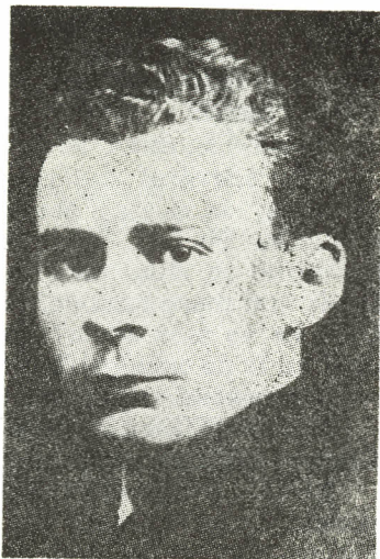
Lucian Blaga, în tinerețe