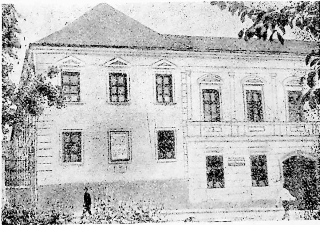
Clădirea vechiului liceu blăjean și a școlii de obște.