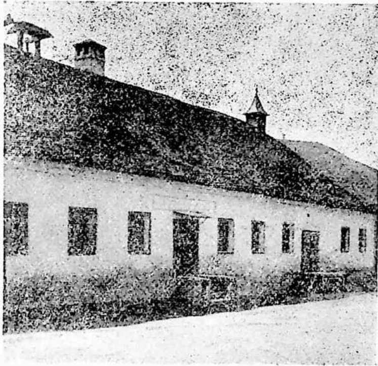
Localul vechii școli grănicerești (sec. al XVIII-lea) din Orlat.