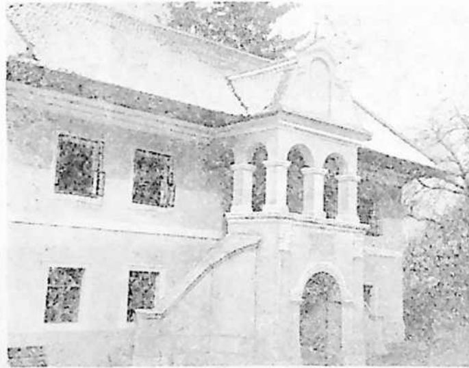
Vechea școală românească de pe lângă biserica Sf. Nicolae din Scheii Brașovului.