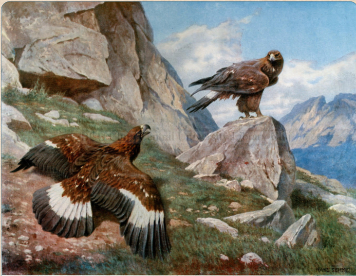
Supliment la revista „Carpații”, Cluj, Strada Regina Maria 96.