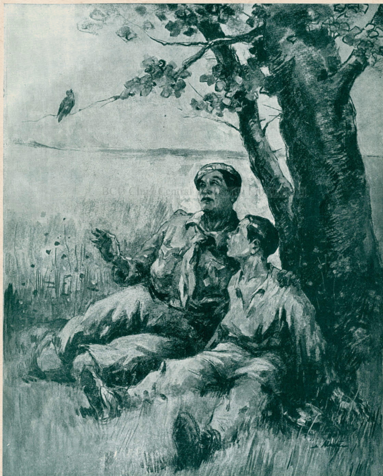
PASERILE NE SUNT PRIETENI!

Revista Carpații , subtitrat Vânătoare. Pescuit. Chinologie , a fost fondată ca urmare a unui pariu în care miza era crearea unei reviste vânătoarești, de calitate, în limba română, de Ionel Pop, om politic și avocat în Cluj. Într-adevăr revista a fost una foarte interesantă, care a adunat atât pasionații de vânătoare, pescuit și câini, cât și iubitorii de natură și oameni de știință. Astfel, o mare parte din articolele revistei tratează teme științifice despre animale, plante, natură și chiar ocrotirea unor specii pe cale de dispariție. O secțiune interesantă a revistei a fost „ Din munți și câmpii ” care cuprindea scrieri scurte de la cititori despre obiceiurile observate din viața animalelor.