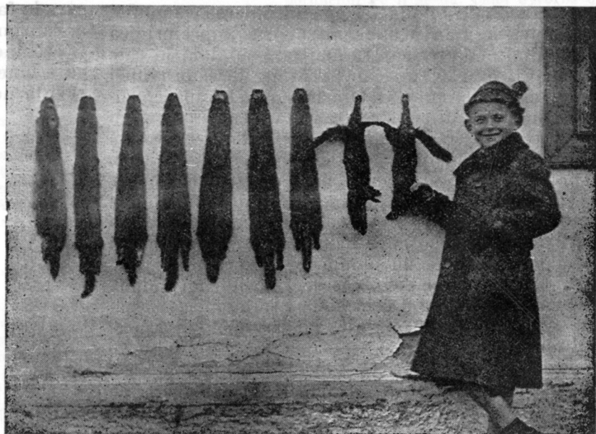
Prada unei ierni: opt norițe și un dihor