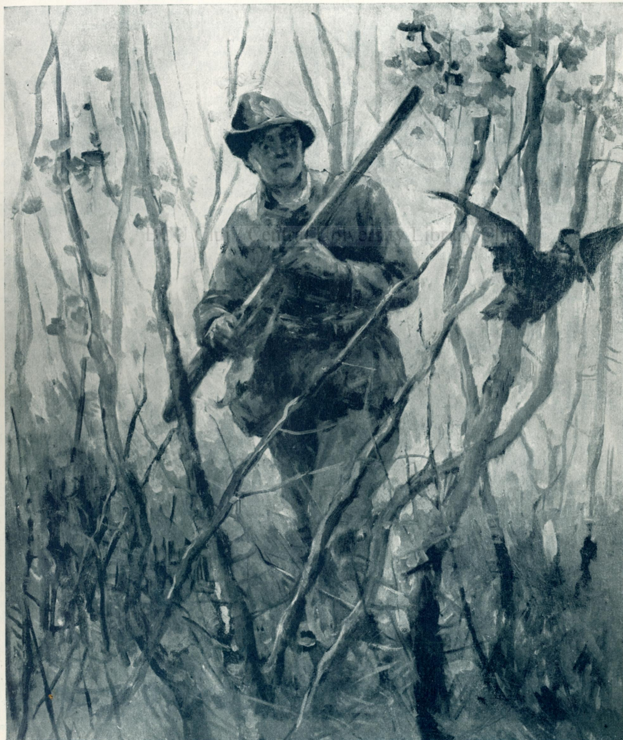
MARTIE - DE: N. MANTU