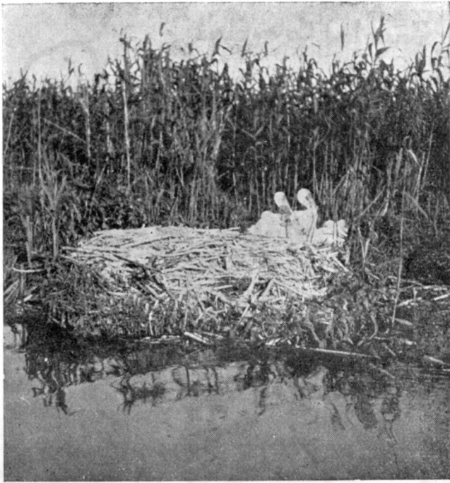
Cuib de pelicani

Sf. Gheorghe poți ajunge și cu trăsură, sau cu corabie cu vâsle dela Sulina, sau dela Tulcea cu vapoare de transport de pește. i) La insula Șerpilor pilotina Comisiunei Dunărei merge numai odată la lună. Nici când nu e fixată precis data plecării. Pilotina rămâne la insulă numai 2—3 ceasuri. Permisuinea de a merge cu pilotine se dă din partea Căpitaniei Portului Sulina.