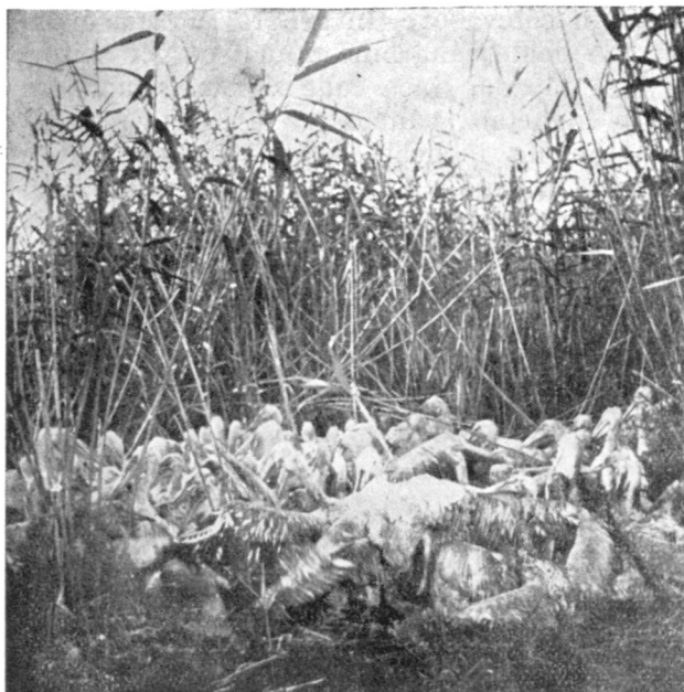
Colonie de pelican la Grindul Stipoc