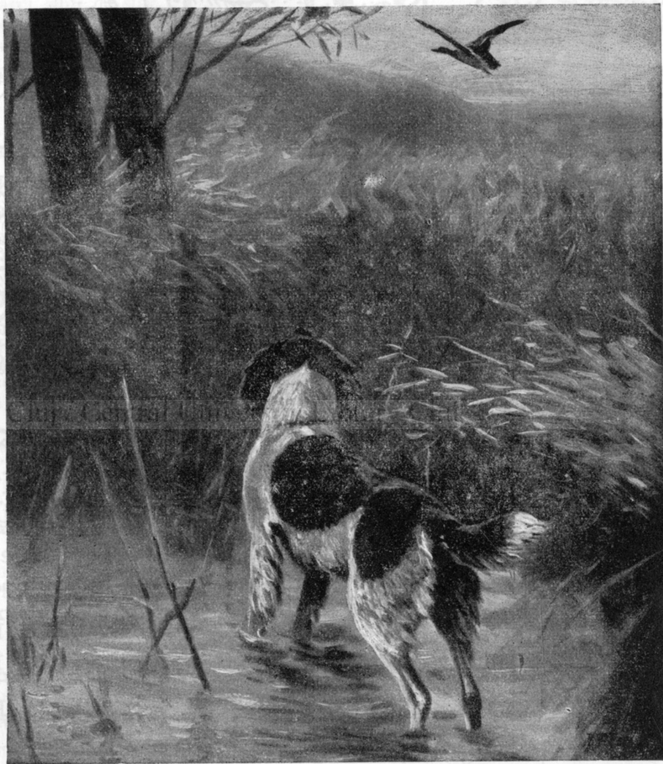
In țara păpuriișului

Pe insulele plutitoare (plaiuri) poți meargă relativ ușor. De sigur, nu mergi, decât pe jos, pe acest teren atât de labil. Adese te cufunzi în apă până la