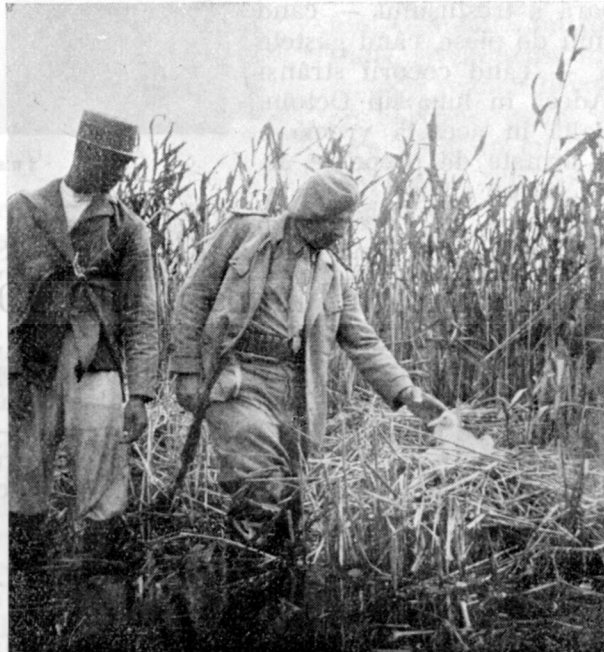
Vizită la o colonie de lopătari lângă Canalul Regele Carol

Permisul de vânătoare. Există două căi, prin care având permisul de vânătoare general, eliberat de stat, să poți obține învoirea specială pentru vânătoare în Deltă: a) Prin Direcțiunea vânătoarei, care la cerere eliberează asemenea permisuri, fixând condițiuni variate. b) Prin un permis de vâ-