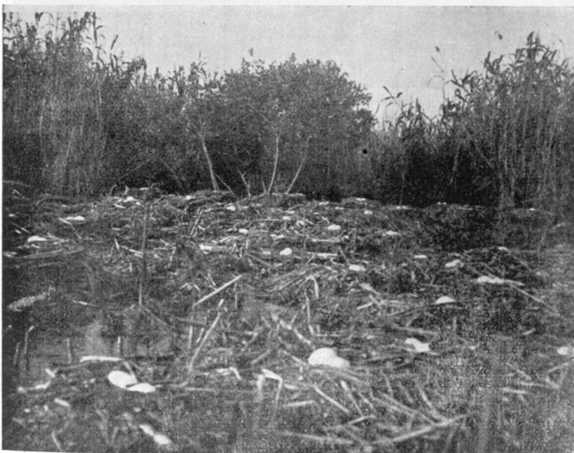
Cuiburi de pelican la Grindul Stipoc

Alimente. E de sine înțeles, că aici, în lumea peștilor, principalul nutremânt, și pentru vânător, este peștele. Prepararea peștelui e primitivă, — dar cu atât mai minunat gust are acest pește. E bine să ai în raniță slănină, salamă, conserve; adică lucruri, care nu se alterează de grabă. Să nu se uite pânea acasă, deoarece în Baltă locuitorii mănâncă aproape