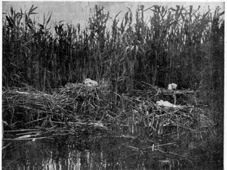
Cuiburi de lopătari

Ce feluri de vânat găsim în Deltă? A) Mamifere: mistreți (foarte mulți în locurile semnalate în schiță), pisici sălbatece (pretutindenea), vidre (în anii din urmă s'au împușinat mult, mai ales în regiunile de vest), norițe (foarte multe în întreaga Deltă), iepuri (deocamdată oprită vânărea lor), vulpi, lupi. — B) Păseri: Cele mai variate specii de rațe (cam 15 specii). Gâște, lebede, trei feluri de pelicani, deosebite specii de stârci. În general fel de fel de păseri acvatice (peste 100 de specii). În afară de aceasta mai multe feluri de acvile și de vulturi hoitari, a căror număr însă s'a împușinat