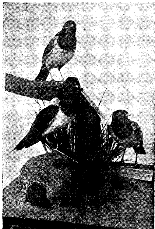
Grupă de Lăcustari (Pastor roseus L.)

La 1 Iunie a. c. acest Pitpălăc a evadat din voliera (în Timișoara) înainte de a primi eventuale instrucțiuni din partea „Institutului Italian interesat în cauză. Rog vânătorii din România că la cazul, dacă acest exemplar va fi vânat în sezonul vânătoarei de pitpălăci, să se remită inelul (eventual pasărea) „Stațiunii Ornitologice Română” Timișoara, pentru datele necesare complectării cercetărilor științifice atât pentru St. Orn. Rom. cât și cea Italiană.