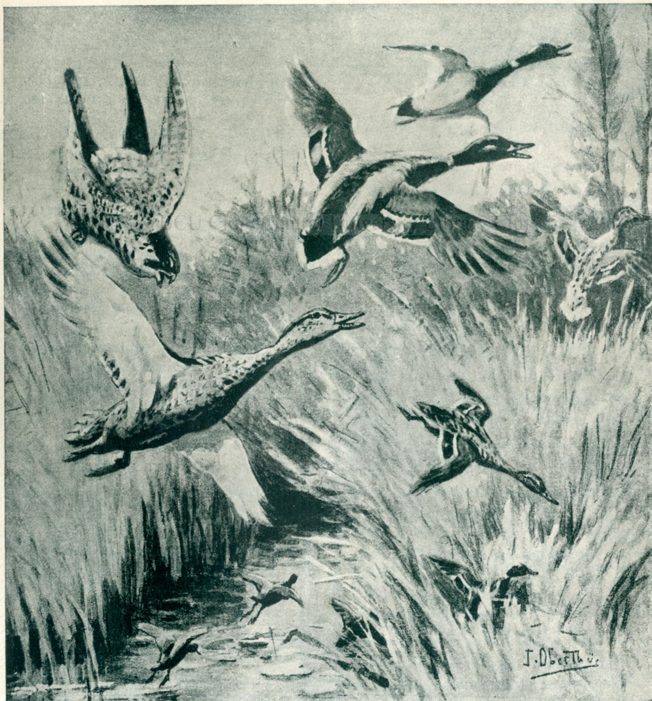
PANICĂ ÎN STUF