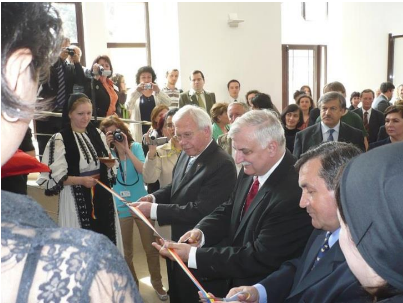
Tăierea oficială a panglicii de inaugurare