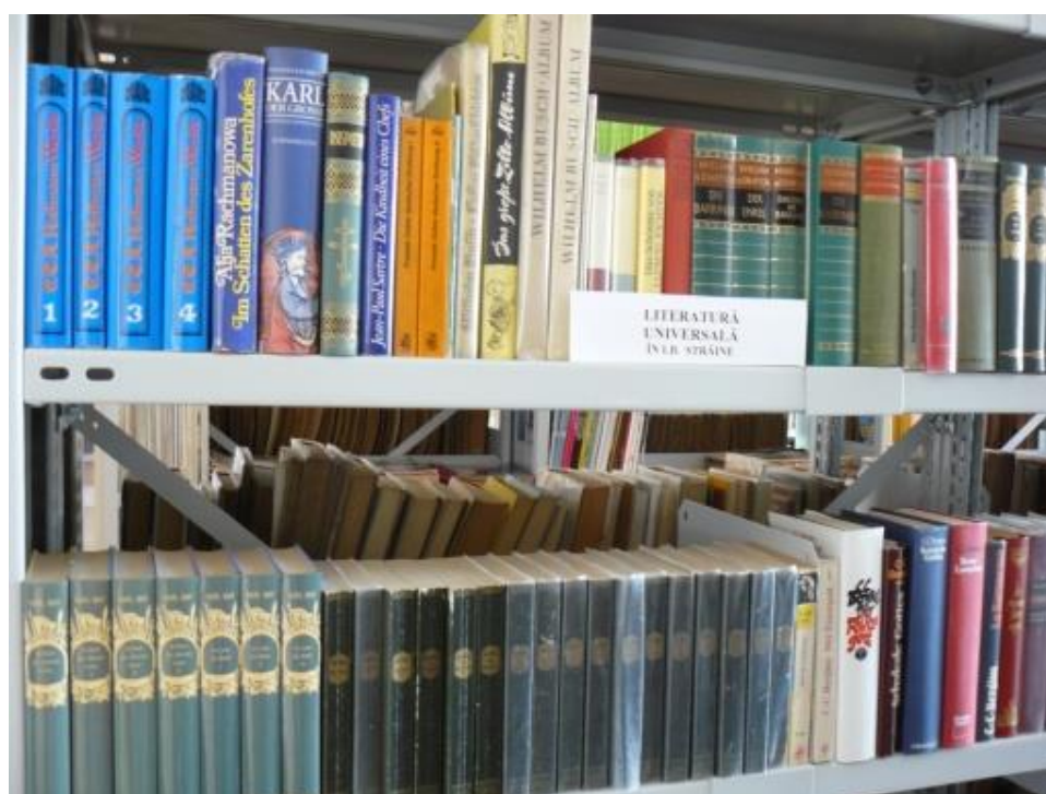
Carti de artă si literatura străină