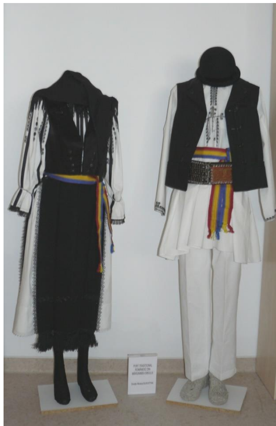
Costume țărănești tradiționale