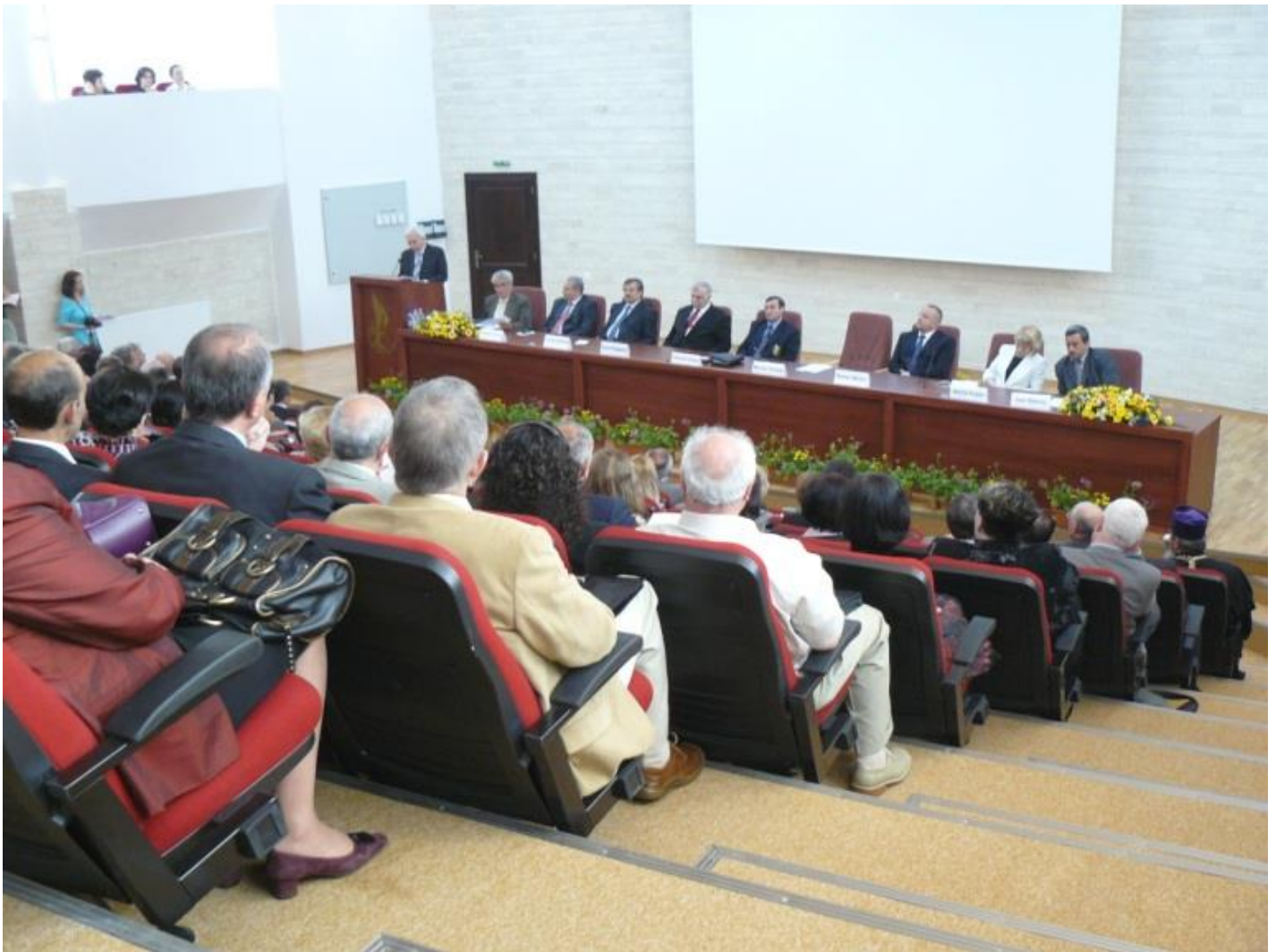
Festivitatea din Aula Magna

După acest moment, a urmat vizitarea oficială a bibliotecii condusă de rectorul universității și directorul bibliotecii, în care au fost prezentate aspectele deosebite ale noului sediu, dotările de ultimă generație în domeniu: sistem modern de securizare al unităților documentare (Rfid), echipat cu etichete inteligente, cu soft ce permite compatibilitatea cu sistemul de gestiune automatizat al bibliotecii, sistem modern de obținere a informațiilor de către utilizator prin intermediul monitoarelor pe care sunt afișate datele de interes, toate echipamentele funcționând integrat cu sistemul de gestiune a bibliotecii, situându-se astfel alături de cele mai moderne biblioteci din țară și străinătate.