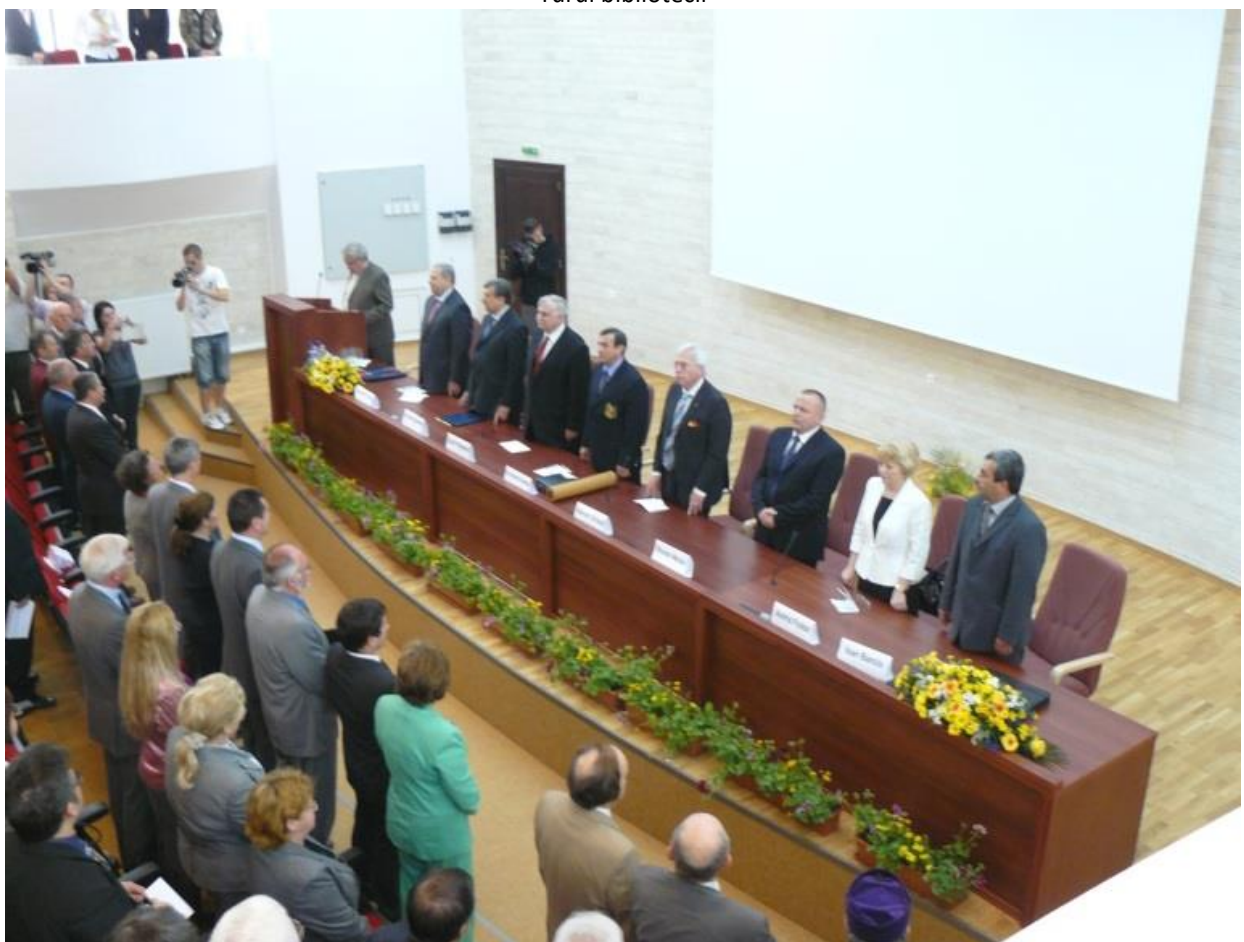
Festivitate in noua Aula Magna a ULBS