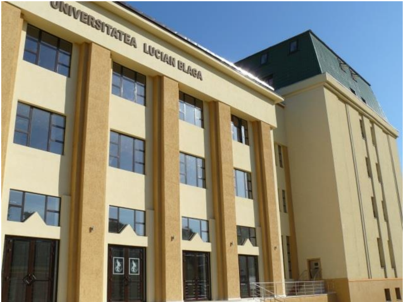
Intrarea în noul sediu

La ceas aniversar, bucuria a fost sporită de inaugurarea noului sediu al Bibliotecii Universității – una dintre cele mai moderne și performante biblioteci din țară, eveniment sărbătorit în ziua de 12 mai 2009.