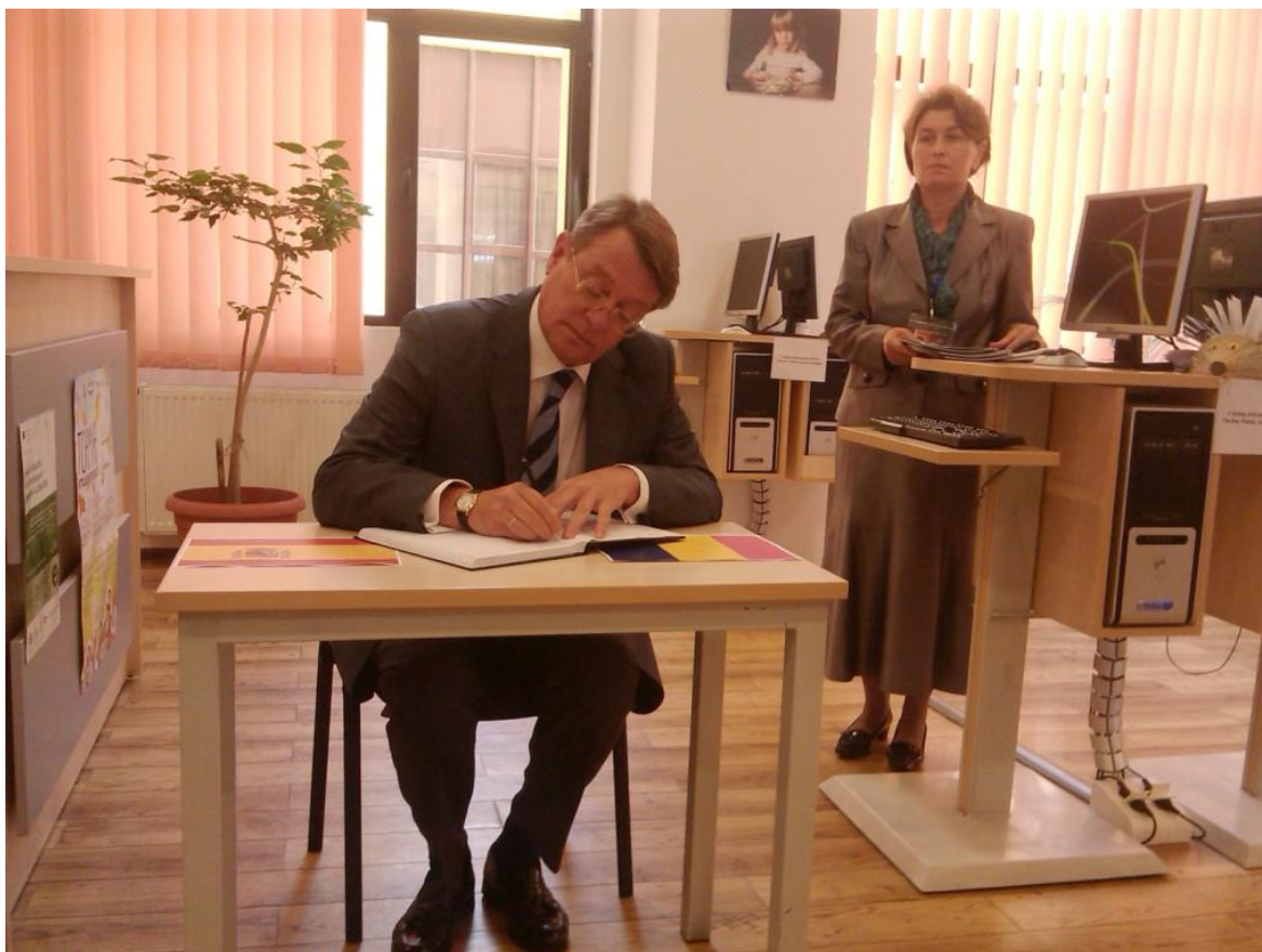
Semnarea in Cartea de onoare a Bibliotecii ULBS