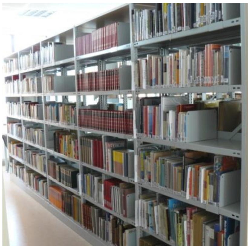
Fondul Blavustiak, donația de carte pentru rafturi cu acces liber