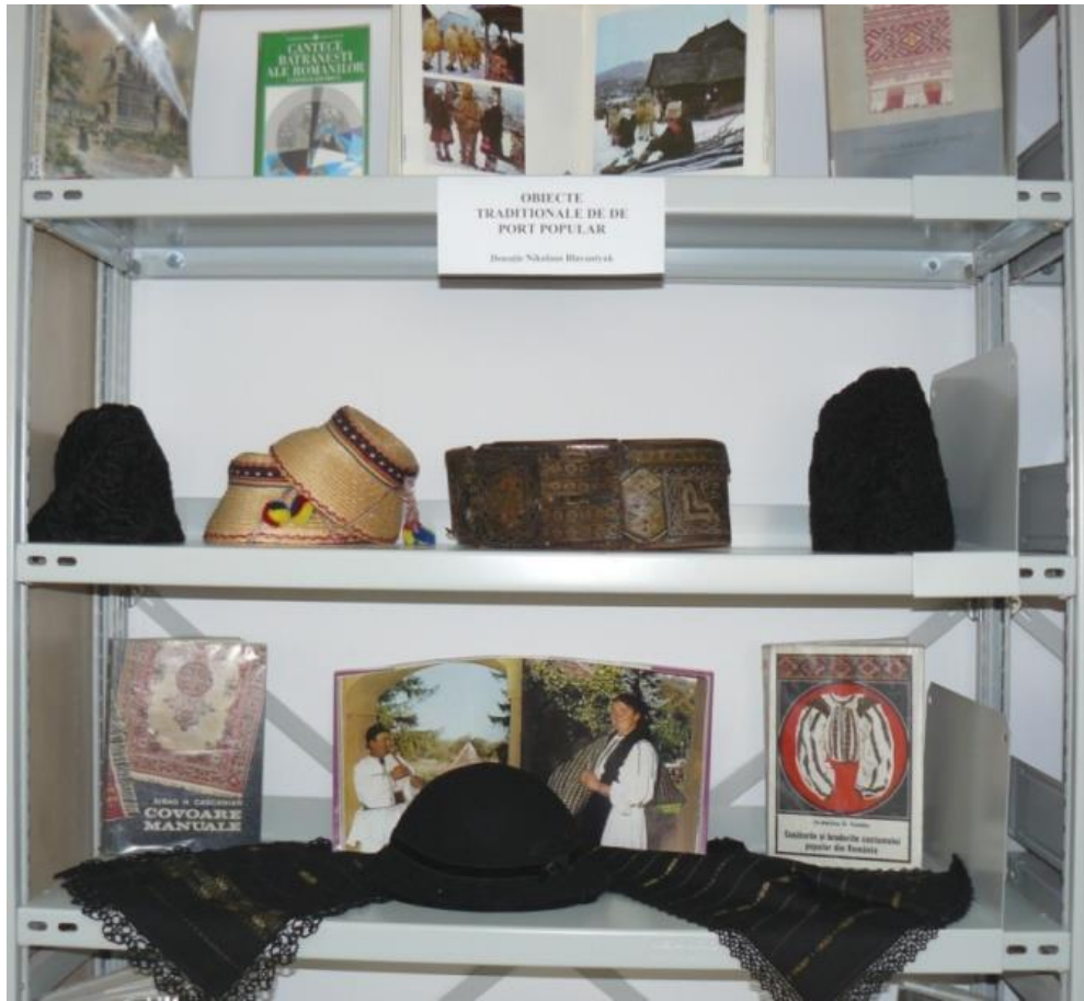
Port popular românesc tradițional