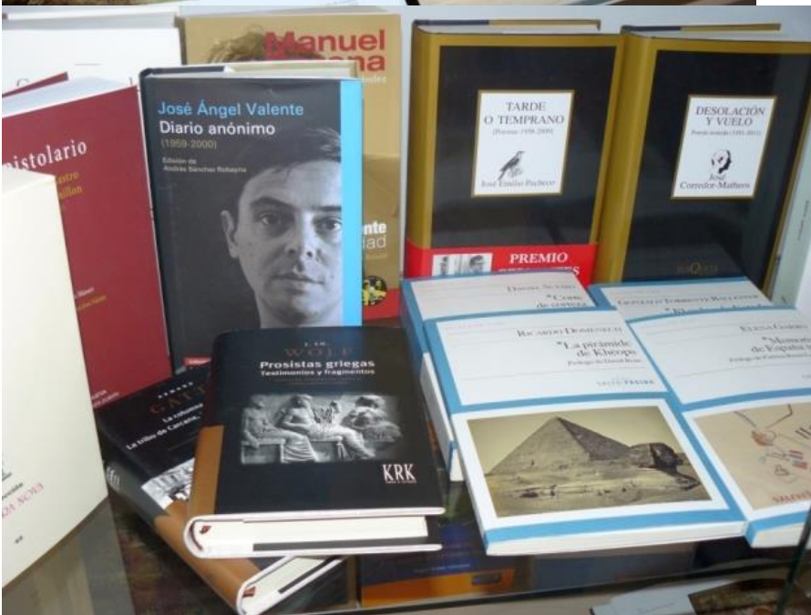
Standul de carte spaniola