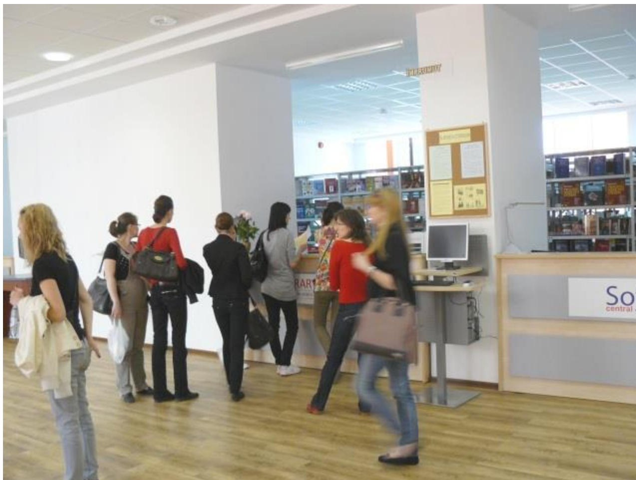
Redeschiderea noii biblioteci publicului cititor

Festivitatea de deschidere a continuat cu alocuțiunile personalităților prezente, care au apreciat și omagiat eforturile depuse pentru ridicarea acestei biblioteci - de acum reper în domeniu - adevărat cadou făcut sieși de către universitate la moment aniversar.