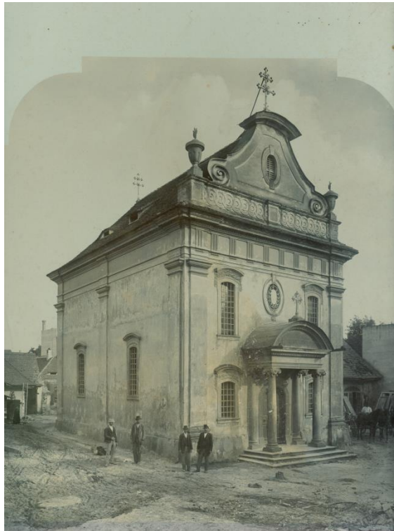
Biserica greceasca de pe strada Macelarilor - Fleischergasse, o modesta biserică cu hramul "Schimbarea la Fata", a fost construită de grecii și aromanii din Sibiu între 1790-1799