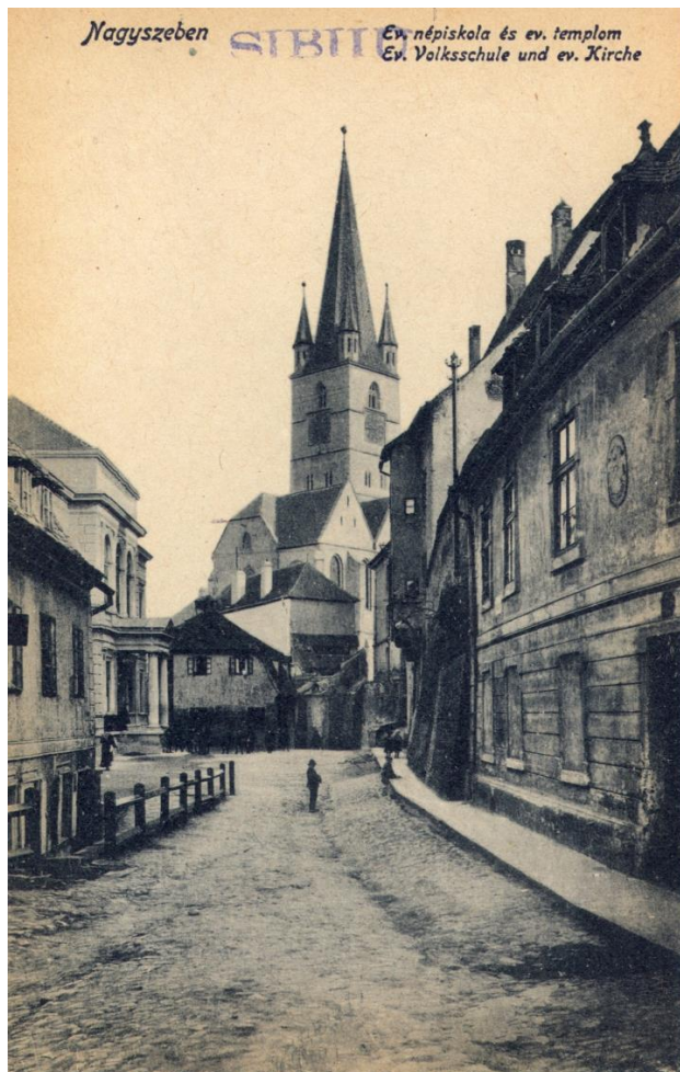
Biserica Evanghelică din Sibiu văzută dinspre strada Pempflinger, 1907