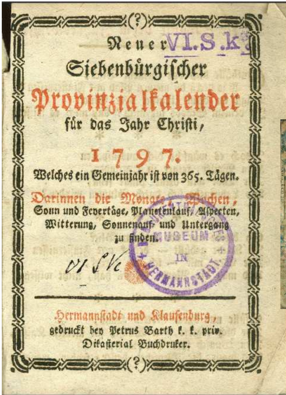
The first calendar, 1797