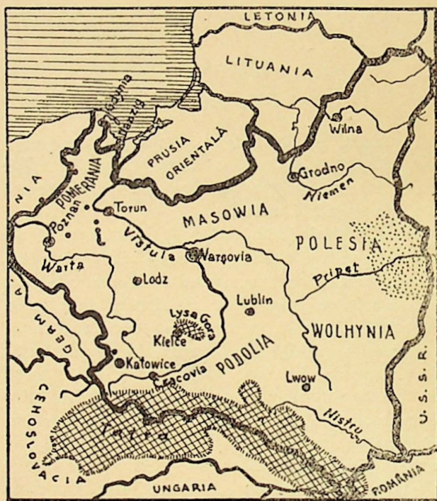
Fig. 1. Harta Poloniei (d. Ahlers)

diș și mâl lăsat de pe urma topirii ghețarilor din vremea Cvaternară. Spre granița de răsărit, se găesc mlăștinele dela Pinsk din regiu-