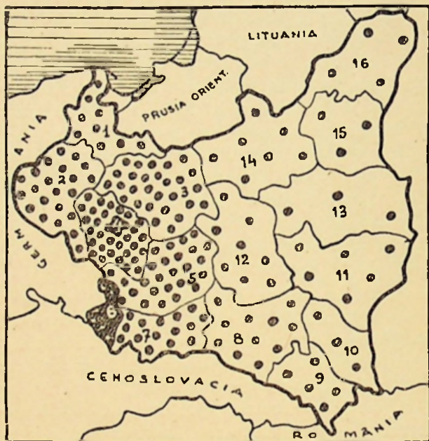
Fig. 2. Răspândirea lucrătorilor industriali în Polonia.

bună calitate și folosește mai ales la fabricarea cocsului. Pe lângă huilă, din Polonia se scot și 250.000 tone de lignit. Nu numai că huilă și