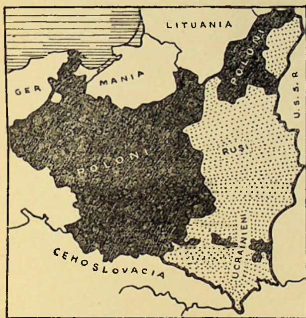
Fig. 4. Populația în Polonia.

Ucrainenii (Ruteni) (peste 7 mil.) locuiesc