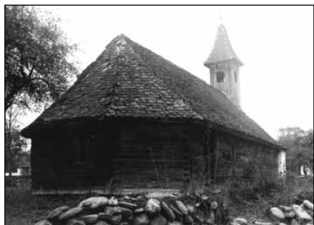
Fig.2 Biserica de lemn din Drăguș, vedere dinspre altar, nord-est