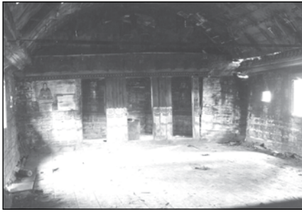
Fig.4 Biserica de lemn din Drăguș, vedere interioară, naosul spre altar, foto arh. H. Teodoru (A.I.N.P., C.M.I., 1540/1933)

în direcțiuni divergente. Zugravul a încercat și perspectiva. În Înălțarea la cer, figura lui Isus, care se înalță asistat de îngeri, e sensibil mai mică decât a personajilor rămase pe pământ. La Nașterea lui Isus, momentele sunt cam disparate. Un păstor își alungă cu mâna somnul care-i apasă pleoapele, alt păstor duce daruri Pruncului și e îmbrăcat cu o imitație de sarică, iar pe cap poartă un fel de glugă flocoasă”.