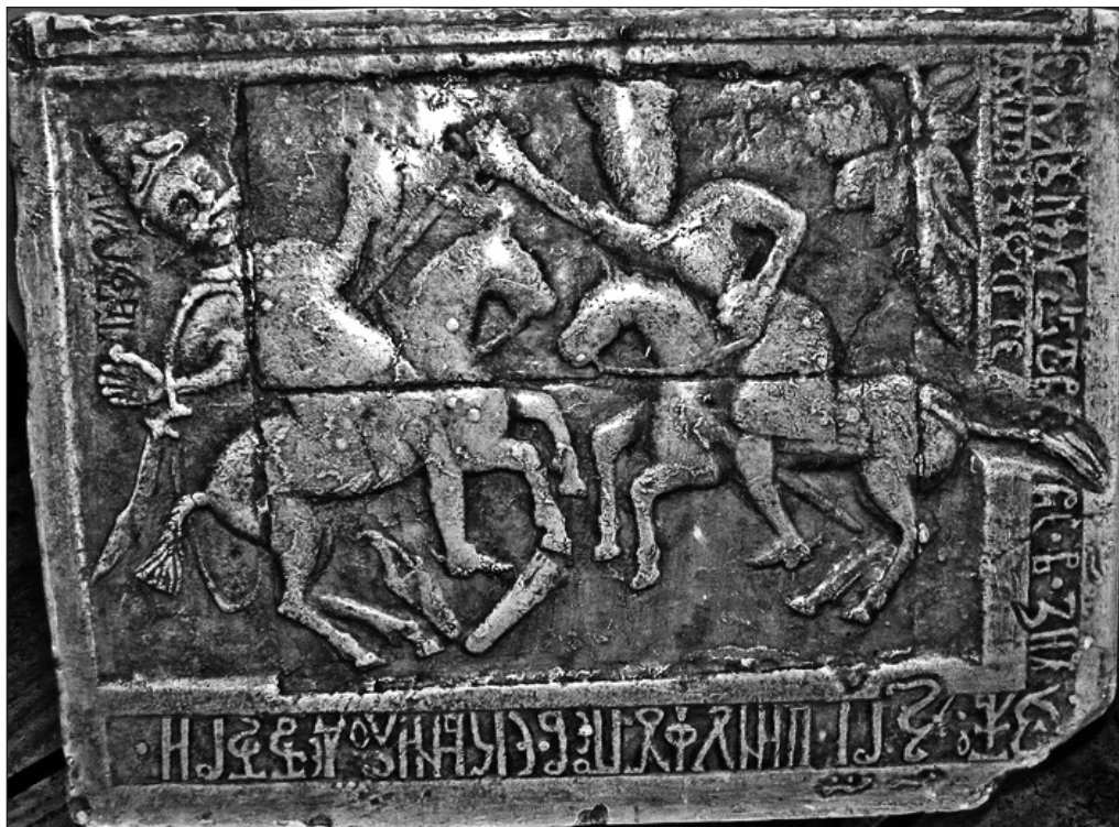
Il. 6: Piatra funerară a războinicului voievodului Mihai Viteazul, Stroe Buzescu (†1602), biserica din Stănești (Vâlcea), detaliu.