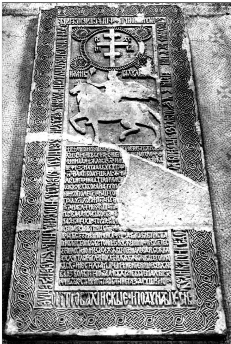
Il. 1: Lespedea funerară a domnului și voievodului Radu de la Afumați (†1529), Biserica mănăstirii, Curtea de Argeș.