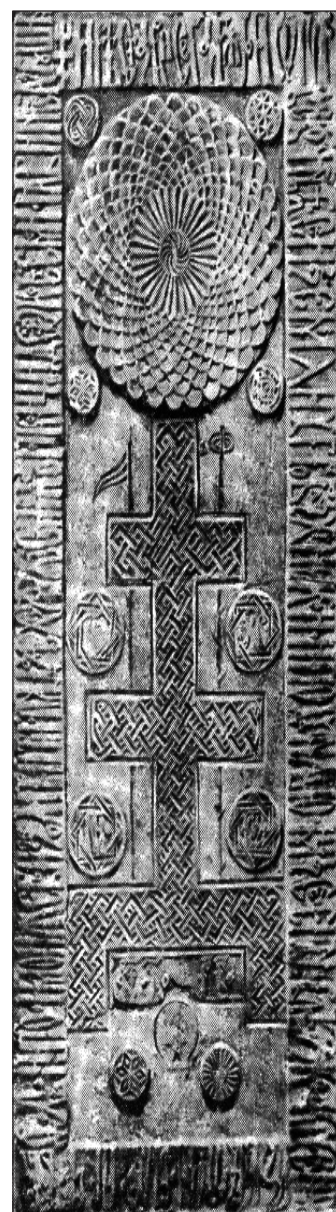
Il. 2: Lespedea funerară a domnului și voievodului Neagoe Basarab (†1521), Biserica mănăstirii, Curtea de Argeș.