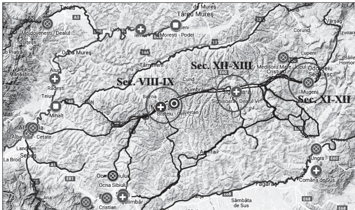
Harta 3. Posibile centre meşteşugăreşti pe valea Târnavei Mari. Cu negru, drumul existent în secolul XVIII conform hărţii iosefine.