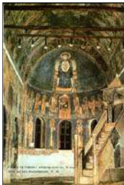
6. Catedrala Patriarhală Sfânta Sophia din Ahrida – Ohrid, secolul X, din anul 1767 transformată în moschee, vedere din interior, spre absida altarului