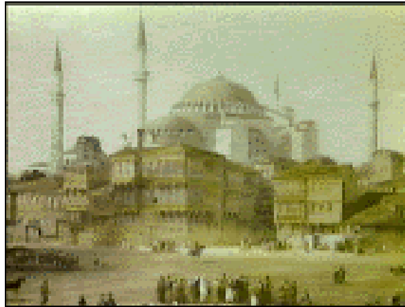
2. Sfânta Sophia din Constantinopol, după 1453, ca și moschee, secolele XV-XX

numele, deși constituia un capitol, de peste un mileniu, al istoriei continentului. Redescoperirea acestui leagăn de credință creștină Ortodoxă, de cultură, de literatură, de arhitectură, de stil subțire de viață și maniere nobile, pe care le-a întruchipat Constantinopolul Noua Romă și Imperiul Romaniei Orientale, s-a făcut și a rămas până astăzi sub peiorativul, oribilul și superficialul termen de „Imperiu Bizantin” [erasio nominis], cu toate derivatele sale. Studiarea acestui capitol de istorie europeană se face încă în contextul preferințelor exotice de „Orientalistică”, alături de egiptologie, iranistică, islam, indologie etc., deși localizarea lui este în Europa. Deci, până când, în mod real, Europa va respira prin cei doi plămâni ai ei [Ortodoxia și Catolicismul], va mai trece încă mult timp. Misiunea istoricilor ortodocși, care au preluat chiar și termenul de „bizantin” din apus, ar fi să accelereze acest proces, pe toate căile și cu toate metodele posibile. În acest context, începutul s-ar putea face prin renunțarea la oribilul termen de „Bizanț” și redescoperirea „Romaniei” și a noțiunii de „romeu”. Arabii și turcii le-au păstrat, dovadă sunt termenii de „Rum Kanissa”, la arabi, și „Rumelia” și „Rum”, la turci, însă creștinii ortodocși din Europa și cei catolici le-au abandonat.