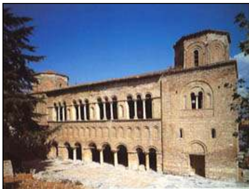
5. Catedrala Patriarhală Sfânta Sophia din Ohrida – Ohrid, sec. X, transformată în moschee de otomani, în anul 1767; vedere din exterior, cu intrarea principală

PENTRU CUM Scriu ARHIEREII LA PAPA, ȚARIGRĂDEANULUI, ALEXANDRIEI, ANTIOHIEI, IERUSALIMULUI ȘI OHRIDULUI. 281