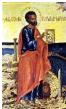
3. Sfântul Evanghelist Marcu

Secolul VII: Sinodul din anul 633 , prezidat de Patriarhul monotelit Cyrus I (630?-644?), prin care face o unire între partizanii săi și teodosieni, adică monofiziți. Monoteletismul și monofizitismul se unesc formal și fac cauză comună în Alexandria, încă din anul 633. În acest scop, el publică un Decret sinodal, în nouă puncte, care, într-un limbaj foarte subtil, apără și justifică această unire. Astfel se încheie epoca Sinoadelor din Alexandria, pentru că după anul 642 creștinii de toate nuanțele vor începe o nouă epocă de conflicte, mult mai dură și neiertătoare, de data aceasta cu islamul.