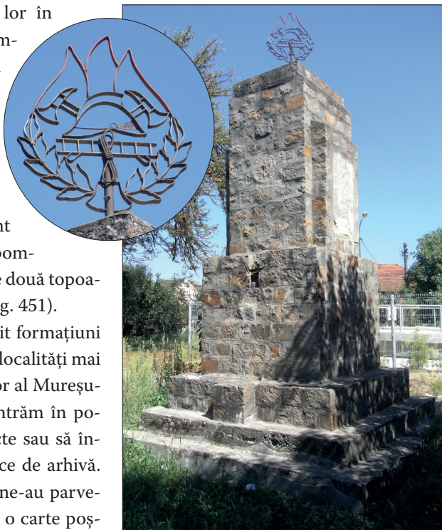
Fig. 451. Radna (jud. Arad). Monumentul ridicat în cinstea pompierilor în parculețul din fața remizei (Foto: 2011)

Fără îndoială, s-au constituit formațiuni de pompieri voluntari și în alte localități mai importante de pe cursul inferior al Mureșului, dar n-am avut ocazia să intrăm în posesia unor informații mai exacte sau să întreprindem cercetări sistematice de arhivă. Unele materiale documentare ne-au parvenit întâmplător, ca de exemplu o carte poștală ilustrată din jurul anului 1900 cu strada principală din Săvârșin , unde se afla remiza de pompieri, demult dispărută (Fig. 452).