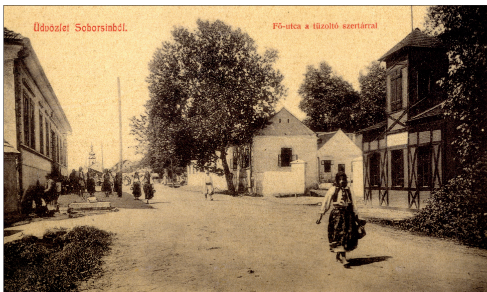
Fig. 452. Săvârșin (jud. Arad). Prima remiză a Asociației Pompierilor Voluntari situată pe strada principală (Carte poștală ilustrată din jurul anului 1900)