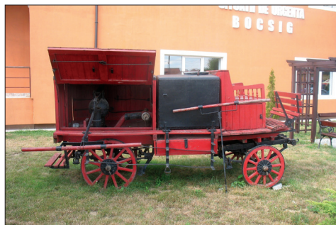
Fig. 446. Bocsig (jud. Arad). Pompa manuală fabricată la „Întreprinderea Metalurgică Aiud” în curtea Formației Civile de Pompieri (Foto: 2010)

La Ghioroc este expusă o pompă manuală de stins incendii în fața primăriei. Nepăstrându-se plăcuța cu marca de fabricație, nu cunoaștem firma producătoare și nici modelul (adică anul de fabricație). Pompa, cu bazin propriu de apă, din tablă nituită, este montată pe o trăsură hipo, având în față o capră dublă pentru servanți; pistoanele