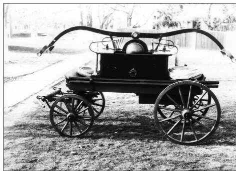
Fig. 445 a – b. Aluniș – Traunau (jud. Arad). Cele două pompe manuale pe trăsură hipo (Fotografii: înainte de 1990)

Ne-au parvenit două fotografii din comuna Aluniș – Traunau, reprezentând două pompe manuale, dintre care una este un model mai „arhaic”, mai rar întâlnit în tipologia pompelor manuale. Montată pe o trăsură hipo, cu șasiu de lemn, fără suspensie, pompa se distinge prin bazinul plasat sub șasiu, cele două pistoane montate vertical la mare distanță fiind acționate de un balansier din lemn, de construcție foarte simplă (Fig. 445 a). Cealaltă pompă manuală, montantă tot pe șasiu de lemn, după aspect pare să fie un produs al fabricii TARNÓCZY din Budapesta (Fig. 445 b).