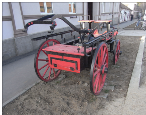
Fig. 447. Ghioroc (jud. Arad). Pompa manuală expusă în fața Primăriei (Foto: 2014)