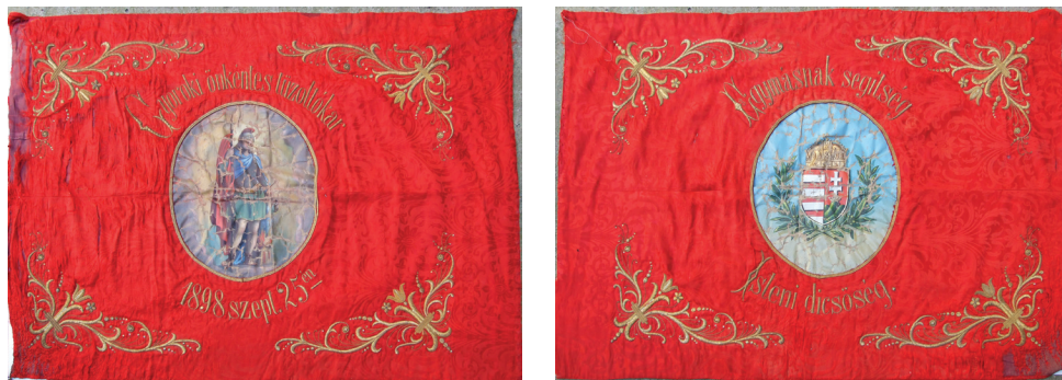
Fig. 448 a – b. Ghioroc (jud. Arad). Steagul Asociației Pompierilor Voluntari din anul 1898 (Complexul Muzeal Arad)

poziționate în V sunt acționate de un balansier confecționat din oțel forjat; recipientul de presiune este de formă sferică, dar, fiind vopsit, nu știm din ce material este făcut (Fig. 447). Pompa făcea parte din dotarea Asociației pompierilor voluntari, înființată cel târziu în anul 1898, de când datează steagul formației (Fig. 448 a - b).