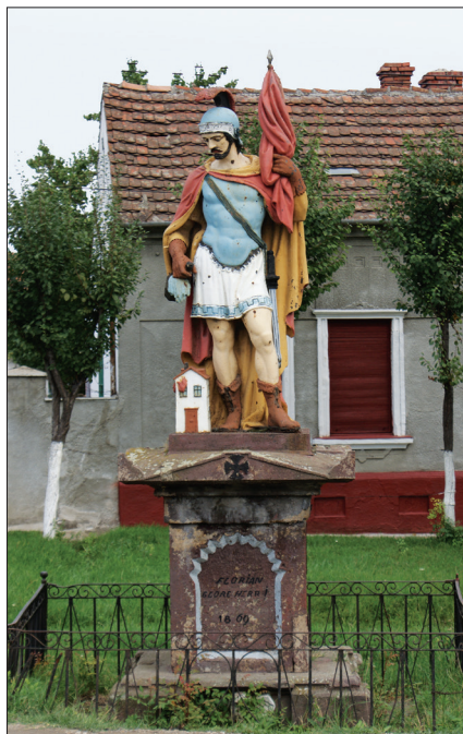
Fig. 444. Arad (cartierul Aradu Nou). Statuia Sfântului Florian (Foto: 2012)

Neexistând evidențe oficiale la nivel de județ, ca să nu mai vorbim la nivel național, și nici alte informații centralizate pentru această categorie de patrimoniu tehnic, din județul Arad avem următoarele exemple, convinși fiind că există și altele, pe care nu le-am întâlnit pe parcursul investigațiilor noastre: