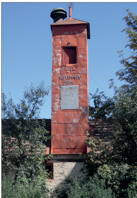
Fig. 450 a - b. Radna (jud. Arad). Remiza cu turnul de pompieri (Foto: 2011)