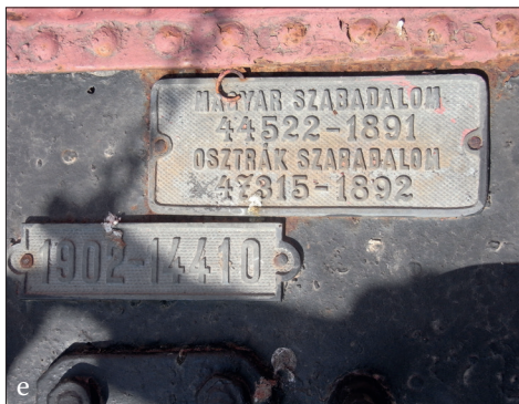
Fig. 535 d – e. Jamu Mare (jud. Timiș). d - e) Pompa manuală detașabilă pe cărucior cu două roți și mai multe plăcuțe de fabricație (Foto: 2013)

tot pe șasiu și cu o ladă identică de scule (Fig. 535 c) și o pompă manuală detașabilă de căruciorul cu două roți ce se trage de o oiște metalică (Fig. 535 d). Se pare că una din cele două plăcuțe cu marca de fabricație, turnate din același metal, provine de la un alt exemplar din dotarea remizei. Încă n-am reușit să identificăm firma MAGYAR SZABADALOM – OSZTRÁK SZABADALOM (adică maghiară și austriacă), și nici nu ne putem explica cum pentru același model apar două plăcuțe indicând ani diferiți de fabricație (Fig. 535 e). Exact aceeași situație inexplicabilă am întâlnit-o și la pompa de la Vermeș (jud. Bistrița-Năsăud) (vezi, supra, p. 324).