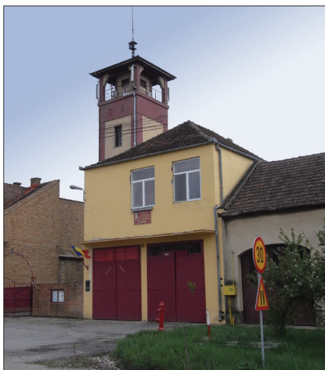
Fig. 536. Jimbolia (jud. Timiș). Muzeul „Florian” înființat în turnul și în remiza Asociației Pompierilor Voluntari în anul 1992 (Foto: 2012)

Cea mai vestică localitate din țară, cu o puternică tradiție agrară și industrială, este Jimbolia, care, în a doua jumătate a secolului al XIX-lea, a cunoscut nu numai o dezvoltare uimitoare pe plan economic, ci și pe plan urbanistic. Acești factori au impus înființarea în anul 1875 a primei formațiuni de intervenții în caz de incendiu, sub denumirea „Reuniunea Pompierilor Voluntari”. A fost ales ca președinte baronul Andreas Cserkonics, iar funcția de comandant i-a fost încredințată lui Georg von Duffaud. Cum s-a arătat mai sus, pentru perfecționarea activității acestei structuri s-au elaborat „Regulamente” încă din anii 1878 și 1882, care pot fi văzute în Muzeul Pompierilor „Florian” din Jimbolia, înființat în anul 1992 cu ajutorul Primăriei și al Muzeului Banatului din Timișoara (Fig. 536).