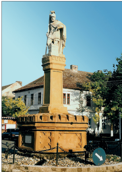
Fig. 539. Jimbolia (jud. Timiș). Statuia Sfântului Florian închinată patronului religios al pompierilor la sfârșitul secolului al XVIII-lea (Foto: 2003)

șionat pe actuala stradă Victor Vlad Delamarina. Este o clădire ridicată pe două nivele, cu o arhitectură simplă, dar ordonată, în cărămidă aparentă. Zona centrală, alcătuită din trei travee, în ușor rezalit, are la parter un pasaj către partea din spate a clădirii. În cele două corpuri, din dreapta și din stânga pasajului, existau patru garaje pentru adăpostirea utilajelor de intervenție. În momentul în care cazarma s-a mutat în actualul sediu de pe