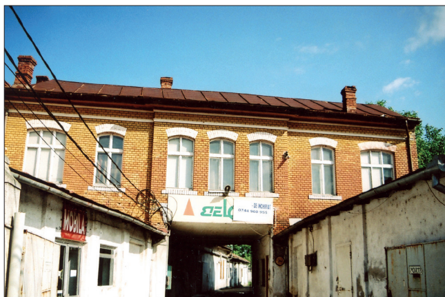
Fig. 540. Lugoj (jud. Timiș). Fosta cazarmă a pompierilor de pe strada Victor Vlad Delamarina (Foto: 2013)

șionat pe actuala stradă Victor Vlad Delamarina. Este o clădire ridicată pe două nivele, cu o arhitectură simplă, dar ordonată, în cărămidă aparentă. Zona centrală, alcătuită din trei travee, în ușor rezalit, are la parter un pasaj către partea din spate a clădirii. În cele două corpuri, din dreapta și din stânga pasajului, existau patru garaje pentru adăpostirea utilajelor de intervenție. În momentul în care cazarma s-a mutat în actualul sediu de pe