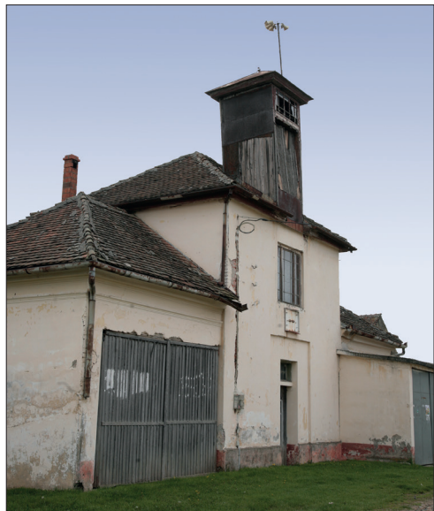
Fig. 543. Satu Nou (jud. Timiș). Vechea remiză de pompieri, reconstruită pentru nevoile actuale (Foto: Walther Konschitzki, 2014)

turn nou, cu trei nivele, cu o platformă de observație enormă, prevăzută cu o balustradă metalică, și două remize (Fig. 542 b).