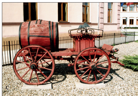
Fig. 535 a – c. Jamu Mare (jud. Timiș). a) Remiza PSI făcând corp comun cu Primăria; b - c) Atelaje de pompieri expuse îngrijit în fața Primăriei, cisterne din tablă de oțel și butoi din doage de lemn pe trăsură hipo