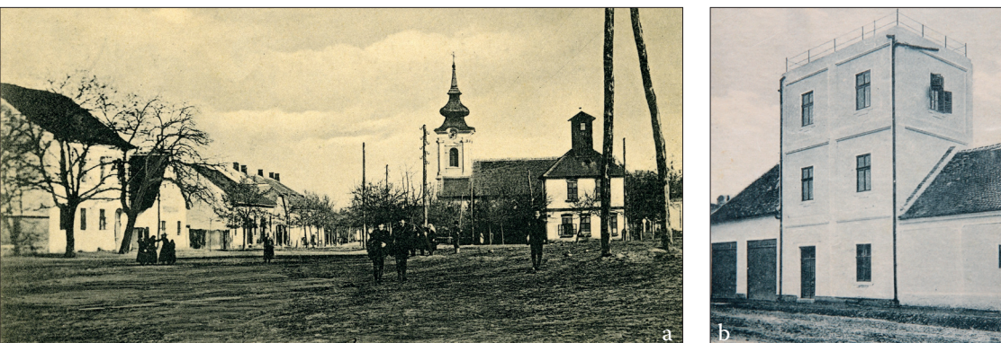
Fig. 542 a – b. Recaş (jud. Timiș). a) Prima remiză a Asociației Pompierilor Voluntari din centrul comunei, a) Carte poștală ilustrată din jurul anului 1910; b) Turnul pompierilor construit în preajma Primului Război Mondial (Carte poștală ilustrată din jurul anului 1915)

- Recaș . Asociația de Pompieri Voluntari din comuna Recaş s-a constituit în prima Adunare generală care s-a ținut în toamna anului 1879. Statutele Asociației au fost aprobate de Minister în 5 septembrie 1880. Primele ustensile, destul de rudimentare, au fost depozitate prima dată într-o casă particulară din piața centrală, dar, cu ajutorul unei donații în bani din partea împăratului Francisc Iosif, s-au putut achiziționa „ustensile” mai performante. Prima remiză, cu un etaj, având și un turn, s-a construit în apropierea nemijlocită a bisericii romano-catolice, înainte de anul 1908 (Fig. 542 a), pentru ca înainte de izbucnirea Primului Război Mondial formația de pompieri să beneficieze de un