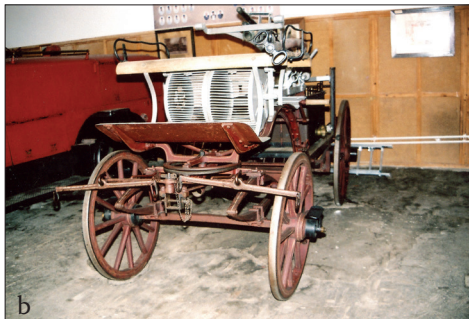
Fig. 537 a - e. Jimbolia (jud. Timiș). Pompe de stins incendii și alte atelaje de pompieri din Muzeul „Florian” : a – c) Cele două modele de pompe manuale tip „Knaust” ; d) Scară culisabilă din lemn pe atelaj tras de cai ; e) Vitrina cu diferite tipuri de căști și cupe dobândite de formațiunea de pompieri (Foto: 2012)