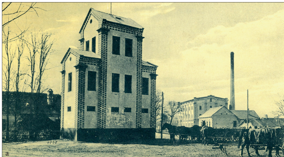
Fig. 538 a – b. Jimbolia (jud. Timiș). Vechiul turn al Pompierilor. a) Carte poștală ilustrată din jurul anului 1900; b) Pictură în ulei pe pânză cu reprezentarea turnului în timpul unui exercițiu sau incendiu (Foto: 2012)