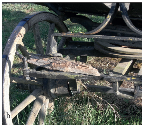
Fig. 483 a - b. Berzovia (jud. Caraș-Severin). Pompa manuală tip „Tarnóczy“ (model 1893) expusă în fața Primăriei. În poziția b se văd stricăciunile provocate de intemperii (Foto: 2014)