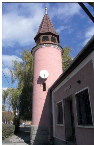
Fig. 474 a – b. Prejmer (jud. Brașov). Remiza cu turnul pompierilor construită în anul 1912

Un Serviciu Voluntar pentru Situații de Urgență funcționează și la Rupea , în sediul vechi al pompierilor (Fig. 475). În cadrul investigației noastre, ne-a surprins respectul echipajului față de trecutul pompierilor din această localitate. Astfel, într-o mică „arhivă” proprie, cum s-a arătat mai sus, aici se păstrează jurnalele, statuetele și rapoartele anuale ale Asociației Pompierilor Voluntari pentru perioada 1889-1911. Cu ocazia inspecțiilor