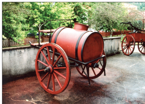
Fig. 481. Reșița (jud. Caraș-Severin). Muzeul Banatului Montan: Cisternă pentru apă din tablă de oțel (Foto: 2014)

din tablă de oțel pe două roți, cu tracțiune hipo (Fig. 481).