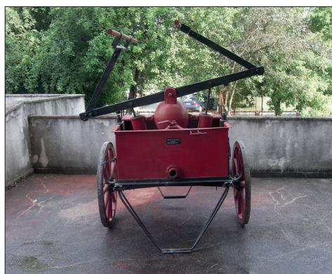
Fig. 479. Reșița (jud. Caraș-Severin). Muzeul Banatului Montan: Pompă manuală cu balansier rabatabil fabricată la „Întreprinderea Metalurgică Aiud” (model 1957) (Foto: 2014)