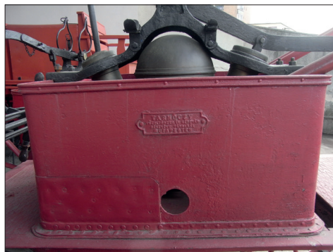
Fig. 478 a – b. Reșița (jud. Caraș-Severin). Muzeul Banatul Montan: Pompă manuală tip „Tarnóczy” (model 1893) (Foto: 2014)