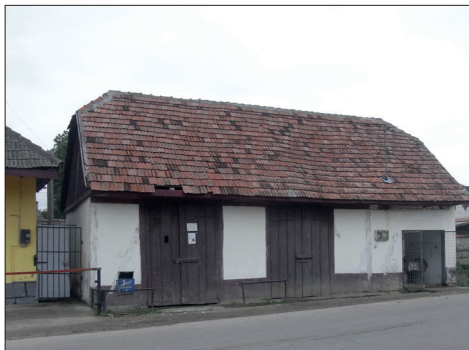
Fig. 473. Măieruș (jud. Brașov). Fosta remiză a Asociației Pompierilor Voluntari (Foto: 2013)

Lupta pentru combaterea incendiilor are o tradiție puternică și în Prejmer , unde Asociația Pompierilor Voluntari s-a constituit în anul 1882. Cu prilejul împlinirii a 30 de ani de la înființarea acestei asociații, s-a construit remiza de pompieri, în centrul comunei, cu un turn rotund, cu acoperiș în formă de coif hexagonal. La parter se află un garaj (Fig. 474 a – b).