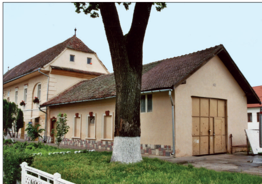
Fig. 471 a – b. Feldioara (jud. Brașov). Remiza de pompieri, făcând corp comun cu Primăria (Foto: 2013)