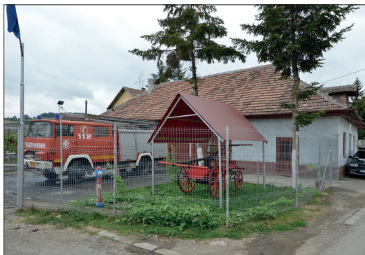
Fig. 475. Rupea (jud. Brașov). Remiza actuală al Serviciului Voluntar pentru Situații de Urgență

Un Serviciu Voluntar pentru Situații de Urgență funcționează și la Rupea , în sediul vechi al pompierilor (Fig. 475). În cadrul investigației noastre, ne-a surprins respectul echipajului față de trecutul pompierilor din această localitate. Astfel, într-o mică „arhivă” proprie, cum s-a arătat mai sus, aici se păstrează jurnalele, statuetele și rapoartele anuale ale Asociației Pompierilor Voluntari pentru perioada 1889-1911. Cu ocazia inspecțiilor