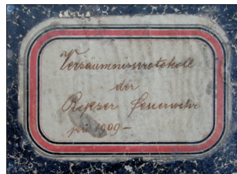
Fig. 476. Pagină din registrul de evidență a activității pompierilor din Rupea din anul 1909 (Foto: 2013)