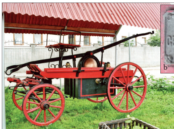
Fig. 477 a - b. Rupea (jud. Brașov). a) Pompa manuală de stins incendii tip „Georg Teutsch” expusă în curtea remizei de pompieri; b) Plăcuța turnată cu numele firmei producătoare din Brașov (Foto: 2013)

prin care s-a controlat prezența pompierilor de serviciu, s-au întocmit procese verbale („Versäumnisprotokolle”), în care s-au consemnat neregulile. La o rubrică specială cu observații sunt menționate și alte evenimente care au conturbat liniștea orașului (Fig. 476). Este laudabilă inițiativa personalului care întreține actualul parc de mașini de intervenție de a fi restaurat în mod exemplar singura pompă manuală de stins incendii cu tracțiune hipo cunoscută până în prezent fabricată de firma Georg Teutsch din Brașov. Pompa, montată pe o trăsură cu suspensie numai pe roțile din față, cu arcuri foi, cu bazinul de apă sub șasiul de lemn, se distinge prin recipientul sferic de presiune voluminos, confecționat din aramă; pistoanele sunt poziționate în V (Fig. 477 a - b).