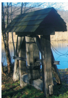
Sistemul de ancorare al cablului ("capra")

Ancorarea cablului se face cu ajutorul unui jug lucrat din lemn masiv de stejar având stâlpi înfipti adânc în pământ. Dintre acestea scara , un pilot înalt cu creștături, folosește pentru a fixa înălțimea cablului, iar capra , un troliu vertical montat într-un schelet masiv de stejar și având un mic acoperiș de scânduri, asigură întinderea corespunzătoare a cablului.