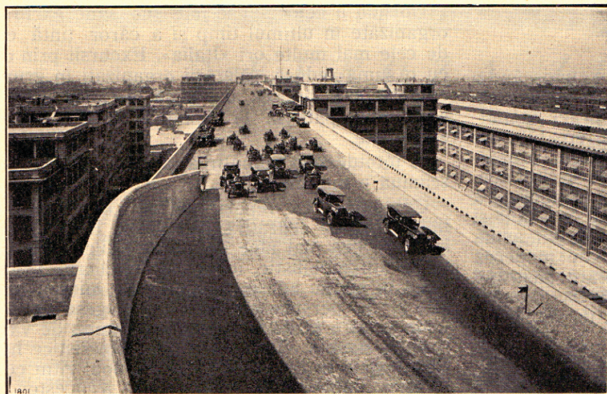
Pista de probă al marelui Stabiliment FIAT.