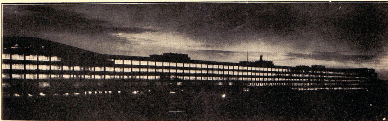
Marele stabiliment FIAT.